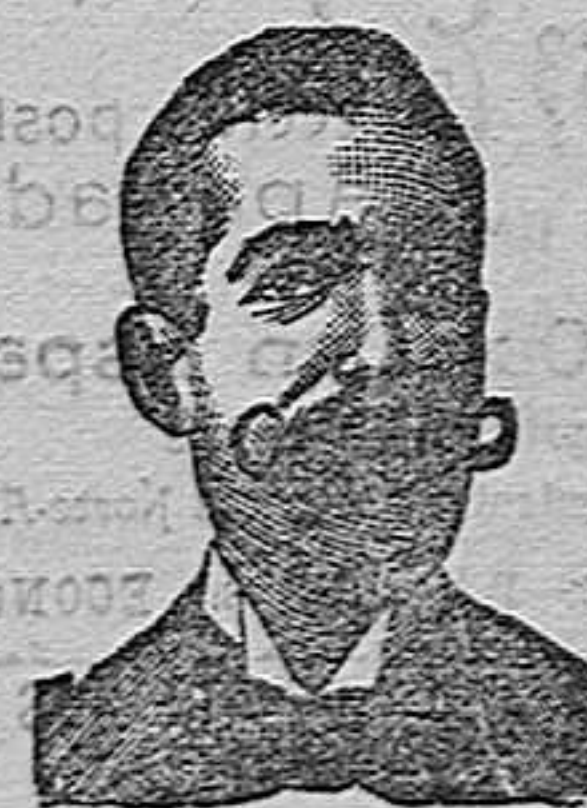
A. SALVATI COSTANZI CALLE DIPUTACIÓN, 435 BARCELONA

Se sirve á domicilio avisando al depósito, calle de Arias Miranda, 1, (antes Casablanca).