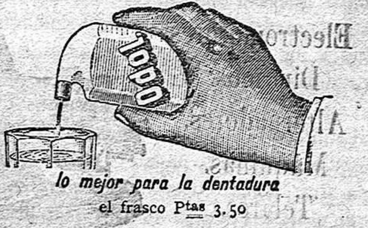
lo mejor para la dentadura el frasco Ptas 3.50

Se halla de venta en la Librería editorial de Bailly-Bailliere é hijos, Plaza de Santa Ana, número 10, y en todas las librerías de Madrid y provincias.