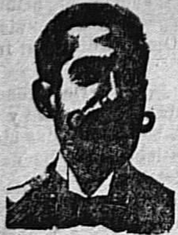
A. SALVATI COSTANZI Calle Diputación, 435.-Barcelona