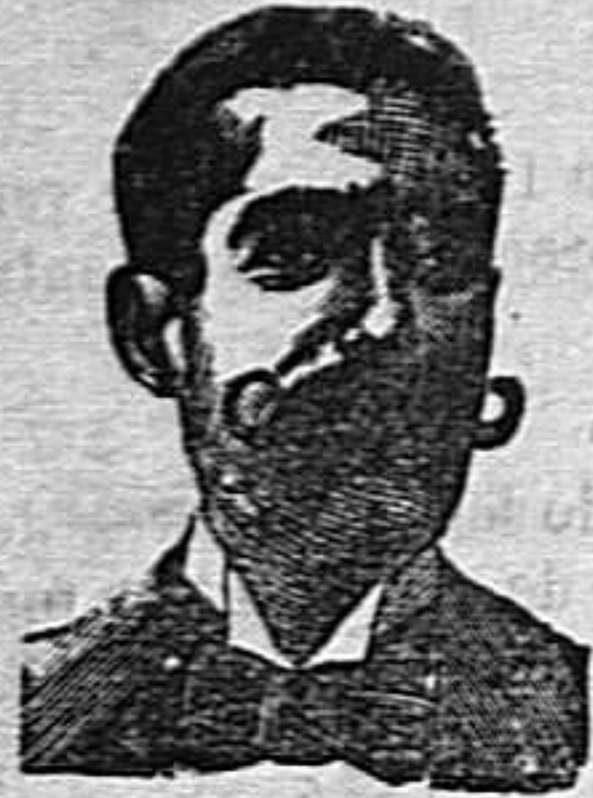
A. SALVATI COSTANZI Calle Diputación, 435.-Barcelona