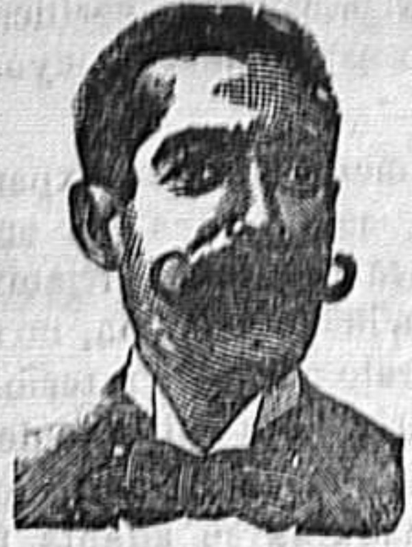
A. SALVATI COSTANZI Calle Diputación, 435.-Barcelona