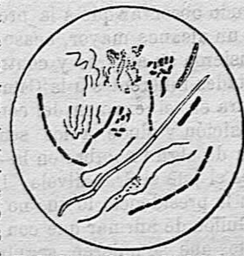
Varias formas de bacterias de la boca.

De ahí se deduce lógicamente, para toda persona dotada hasta de mediana inteligencia, que si se quiere preservar los dientes del peligro de cariarse, es preciso reducir á la impotencia esas bacterias. Hac: un siglo, cuando aparecieron la mayor parte de los dentífricos todavía usados hoy día, se ignoraban totalmente la existencia y los trabajos de estos microbios, que hoy, por confesión unánime de los sabios del mundo entero, son reconocidos como causantes de la descomposición y de la caries de los dientes. No se pudo dar, pues, 100 años atrás con otra cosa que con pobres dentífricos que perfumaban algo la boca, pero que no podían menos de dejar corromperse los dientes. La ciencia moderna, al contrario, no sólo ha hallado la verdadera causa de la caries, sino que al