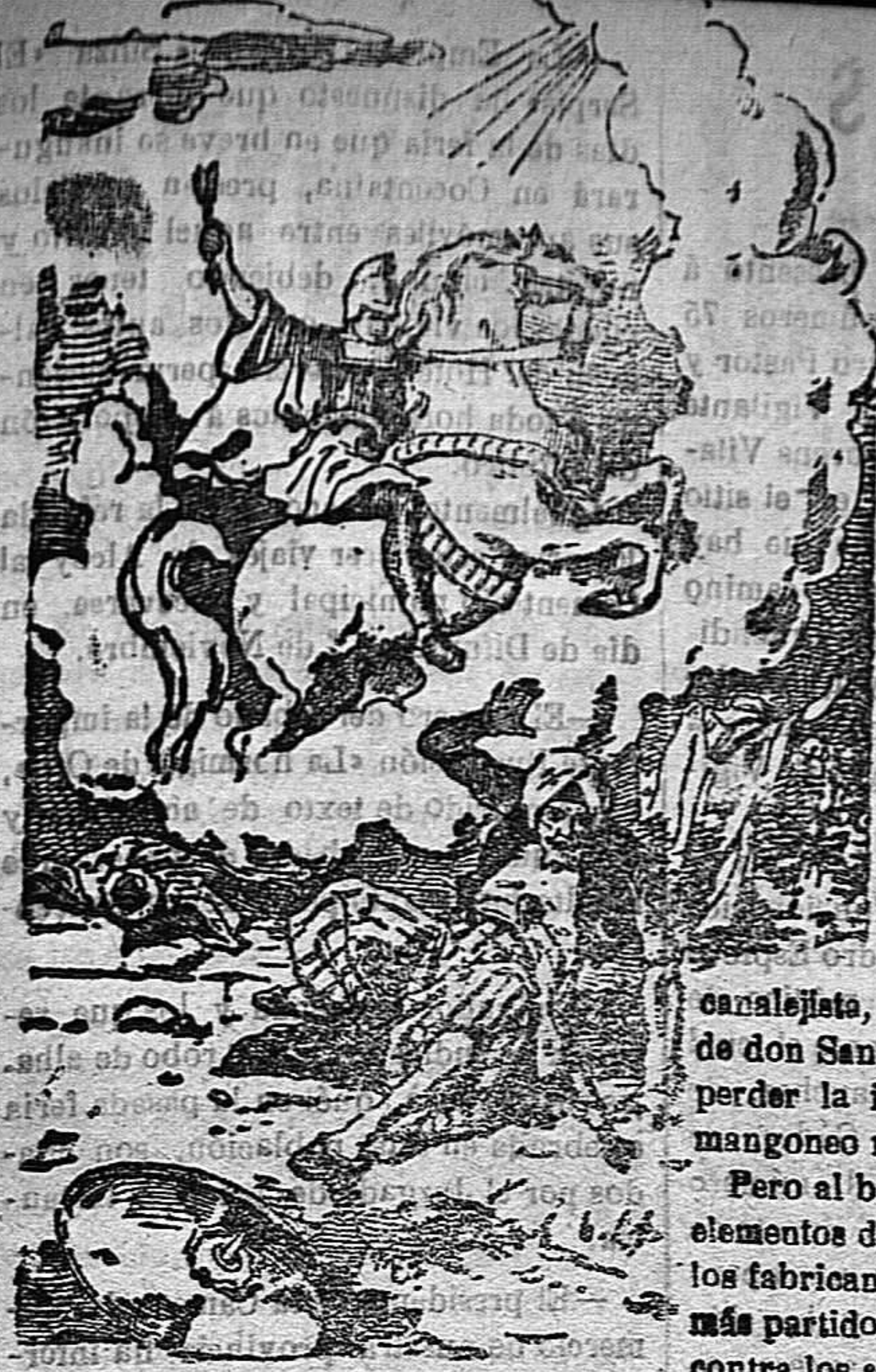
Juvenio Martí San Jorge! Veni in adiutorium populi Dei. Defiende al pueblo de Dios

Precios de suscripción Alcoy al mes . . . . . 150 Ptas. Para los obreros al mes. 0'75 Ptas. Fuera al trimestre . . . . . 4'50 Ptas. Número atrasado . . . . . 0'15 Ptas.