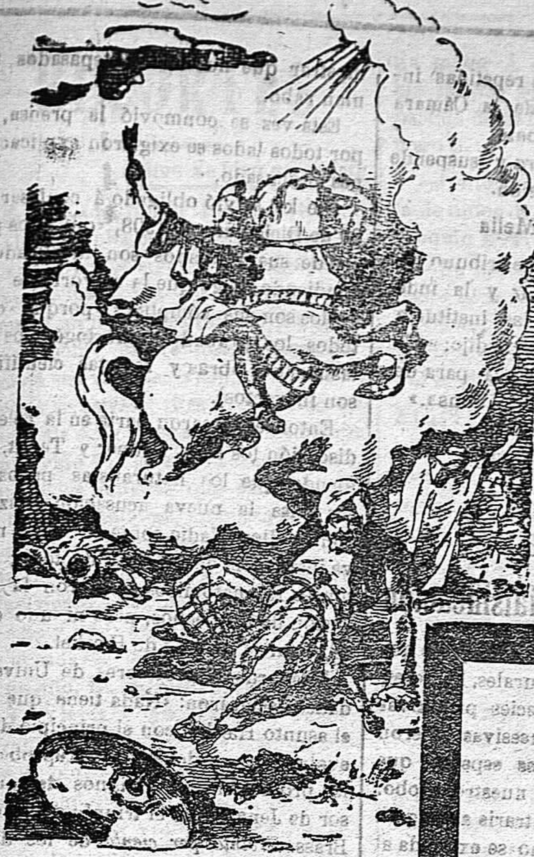
¡Juicio Mártir San Jorge! Defiende al pueblo de Dios!

Redacción y Administración Calle Pintor Casanova N.º 24