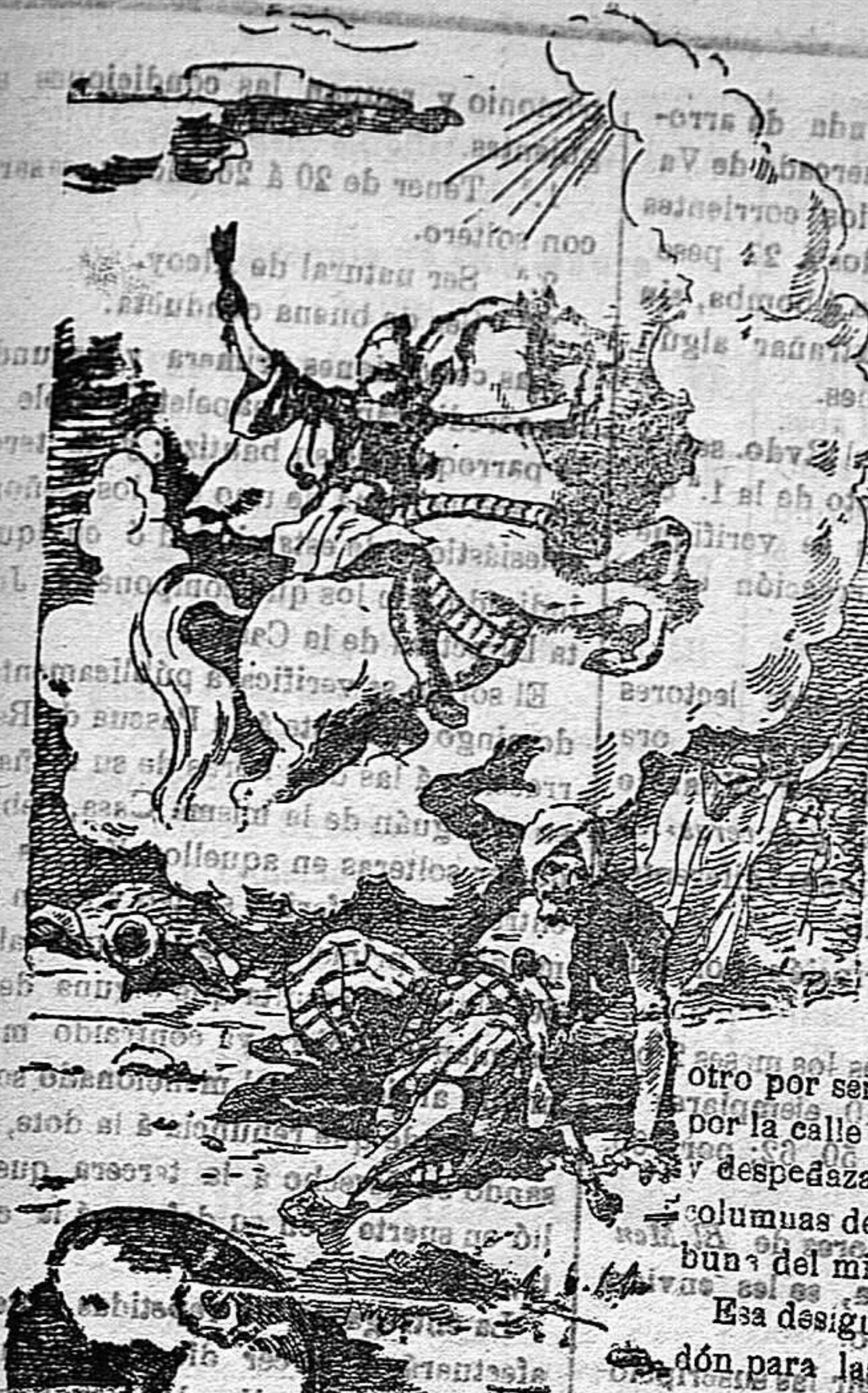
¡Vive! ¡Martir San Jorge!

Precios de suscripción Alcoy al mes... 1'50 Ptas. Para los obreros al mes... 0'75 Ptas. Fuera al trimestre... 4'50 Ptas. Número atrasado... 0'15 Ptas.