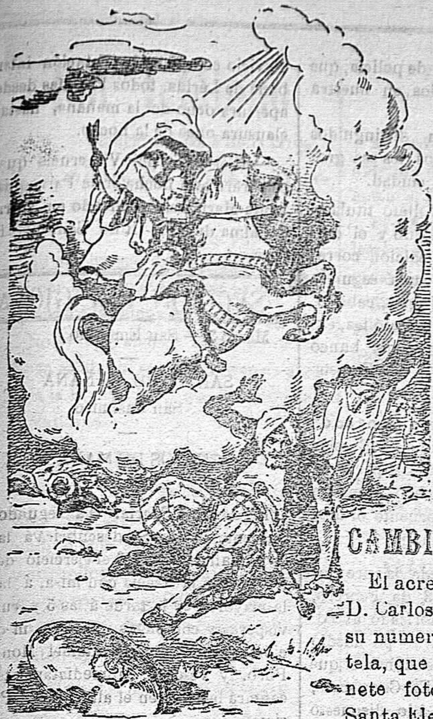
Juicio Mártir San Jorge Veni in adiutorium populi Dei Officia eccles.

Redacción y Administración Calle Pintor Casanova N.º 24