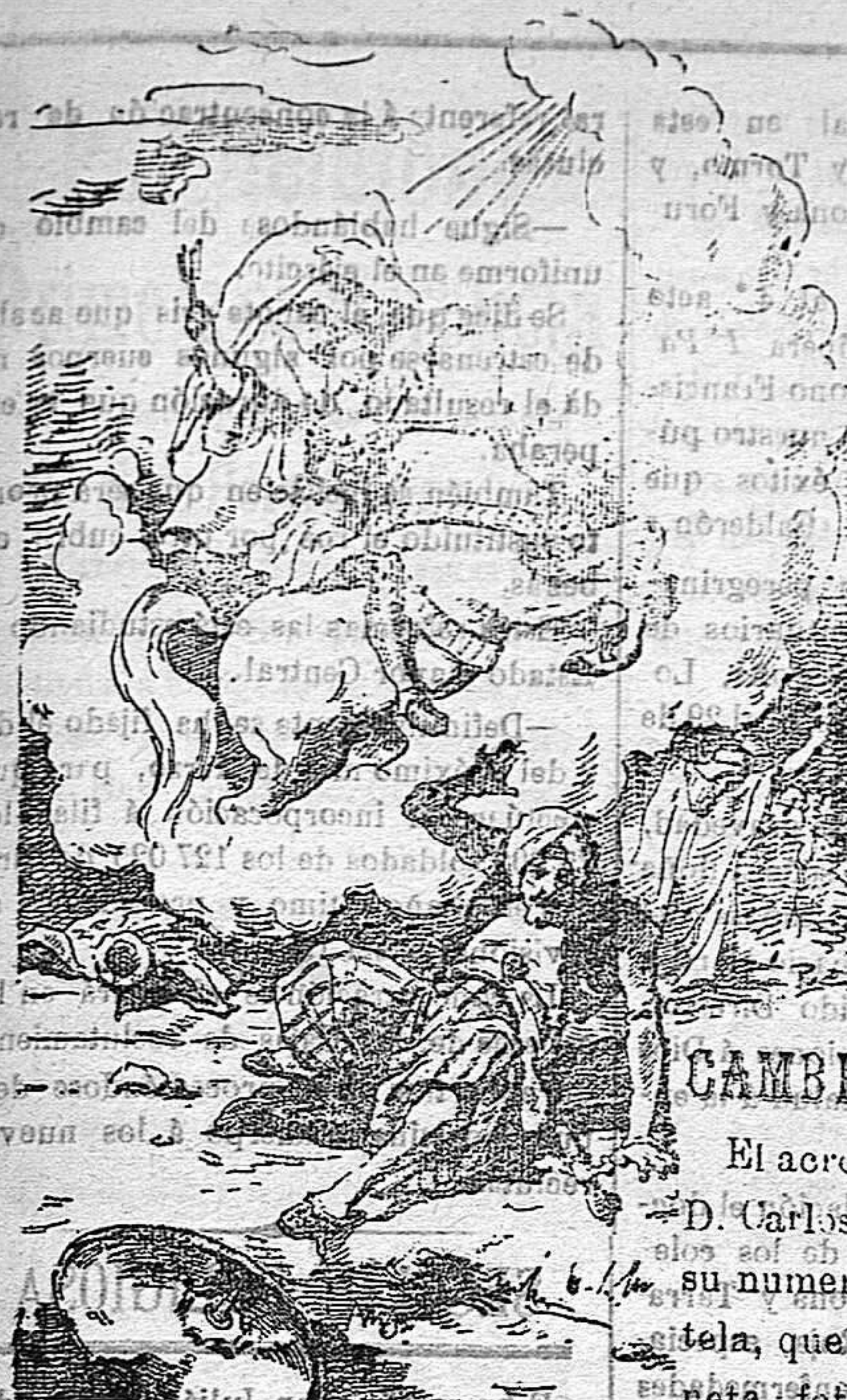
¡Juicio Mártir San Jorgel Defiende al pueblo de Dios

Precios de suscripción Año al mes... 1.50 Ptas Para los otros al mes... 0.75 Ptas Fuera al trimestre... 4.50 Ptas Número suelto... 0.15 Ptas