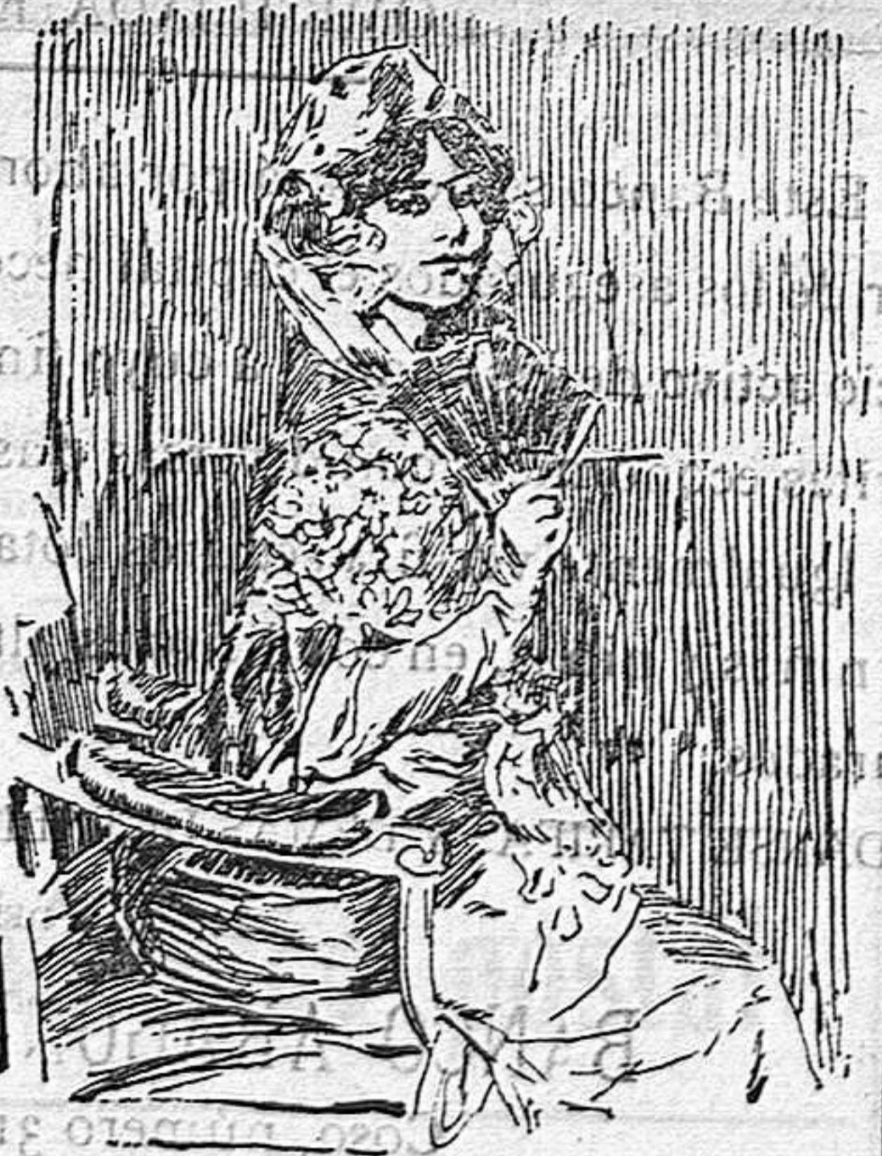
Apunte del cuadro de I. Zuloaga, La del abanico.

Empezamos por uno del cuadro «En la Iglesia», con que se ha presentado a la Exposición el laureado artista Gonzalo Biibao.