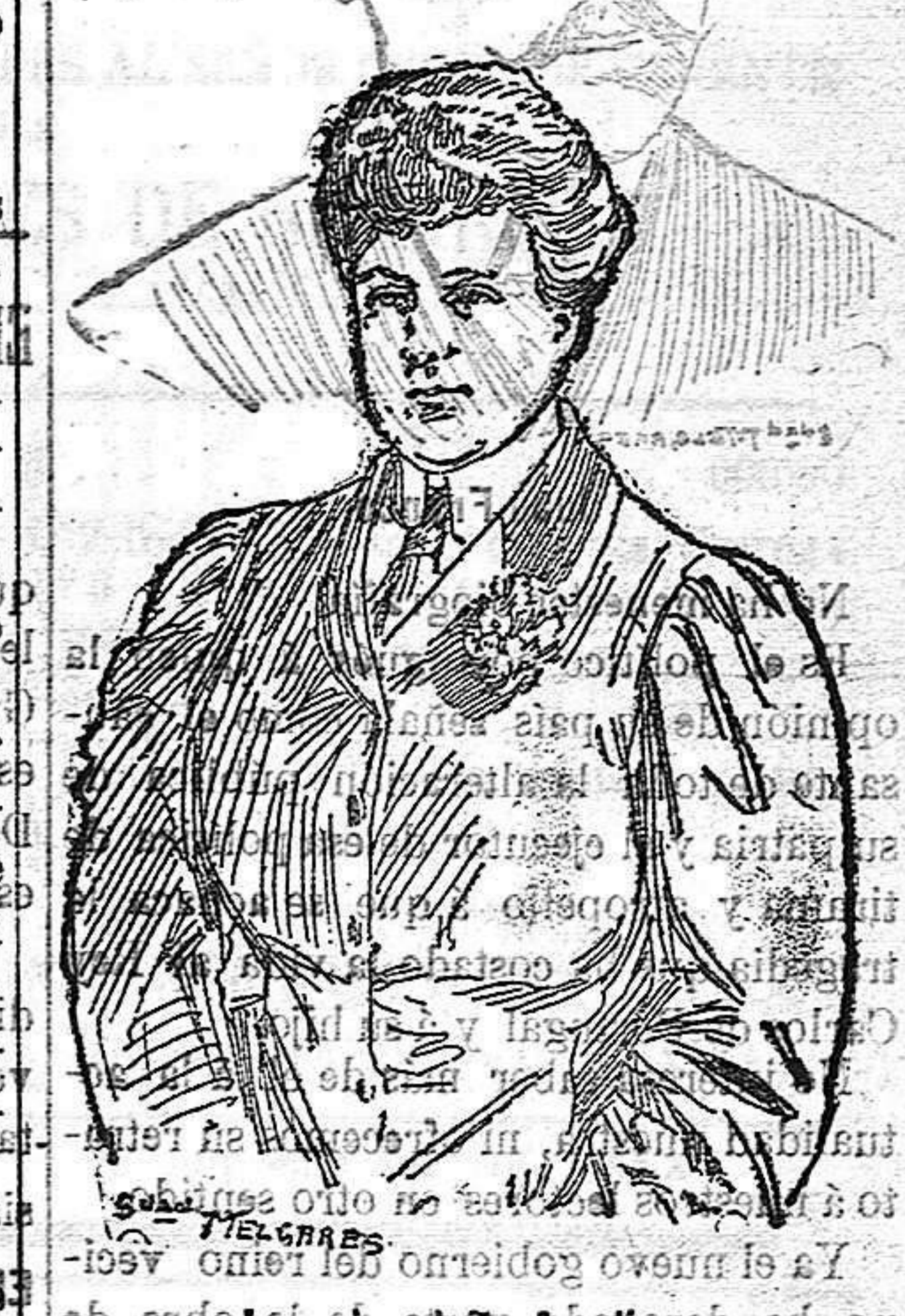
La reina doña Amalia

Su gracia, su hermosura y su llaneza cautivaron a los madrileños, que la aplaudían y vitoreaban con entusiasmo siempre que se mostraba en público.