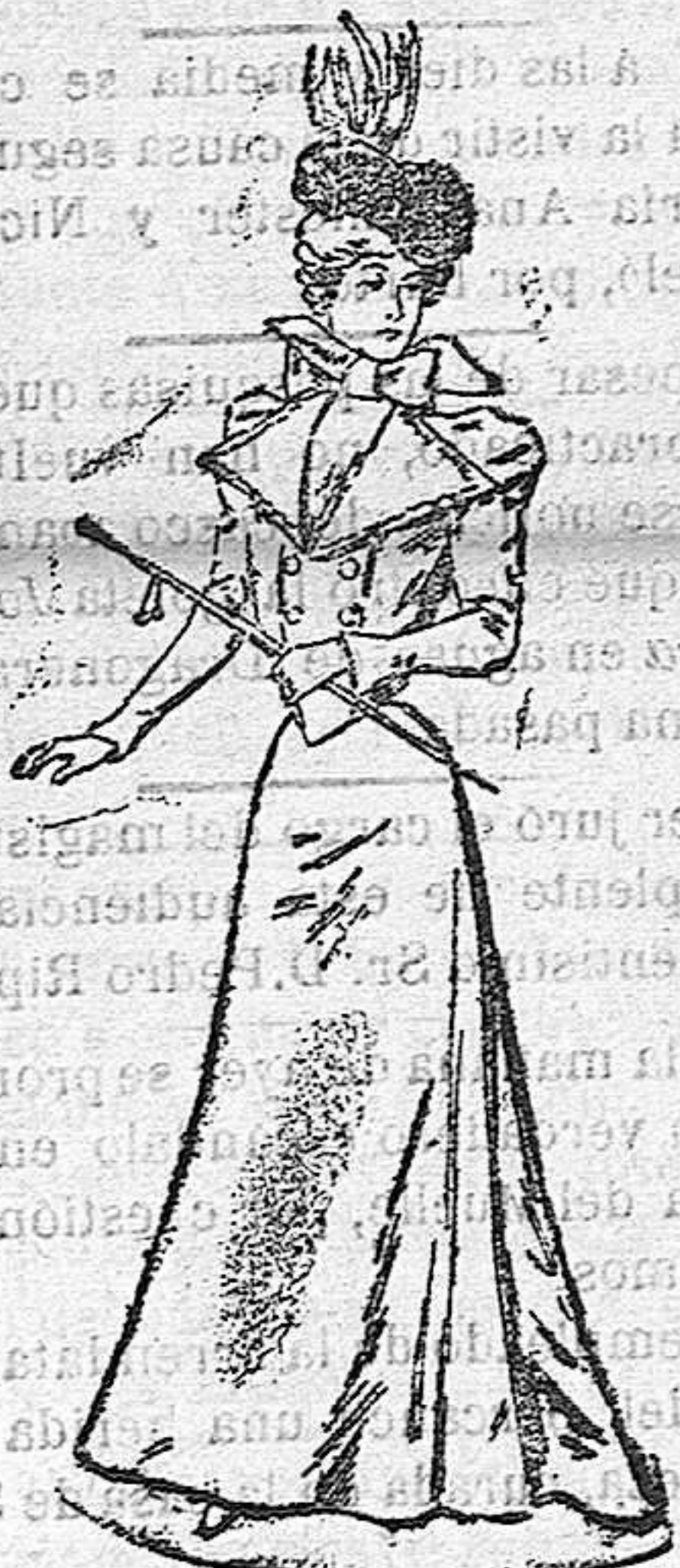
Traje para entretiempo

Cuerpo blusa de guipur sobre un viso tornasol, color lila, adornado con dos cintas alrededor del escote; mangas de guipur; falda de glasé tornasol, color lila, con doblefalda de guipur, y cinturón de cinta con lazada.