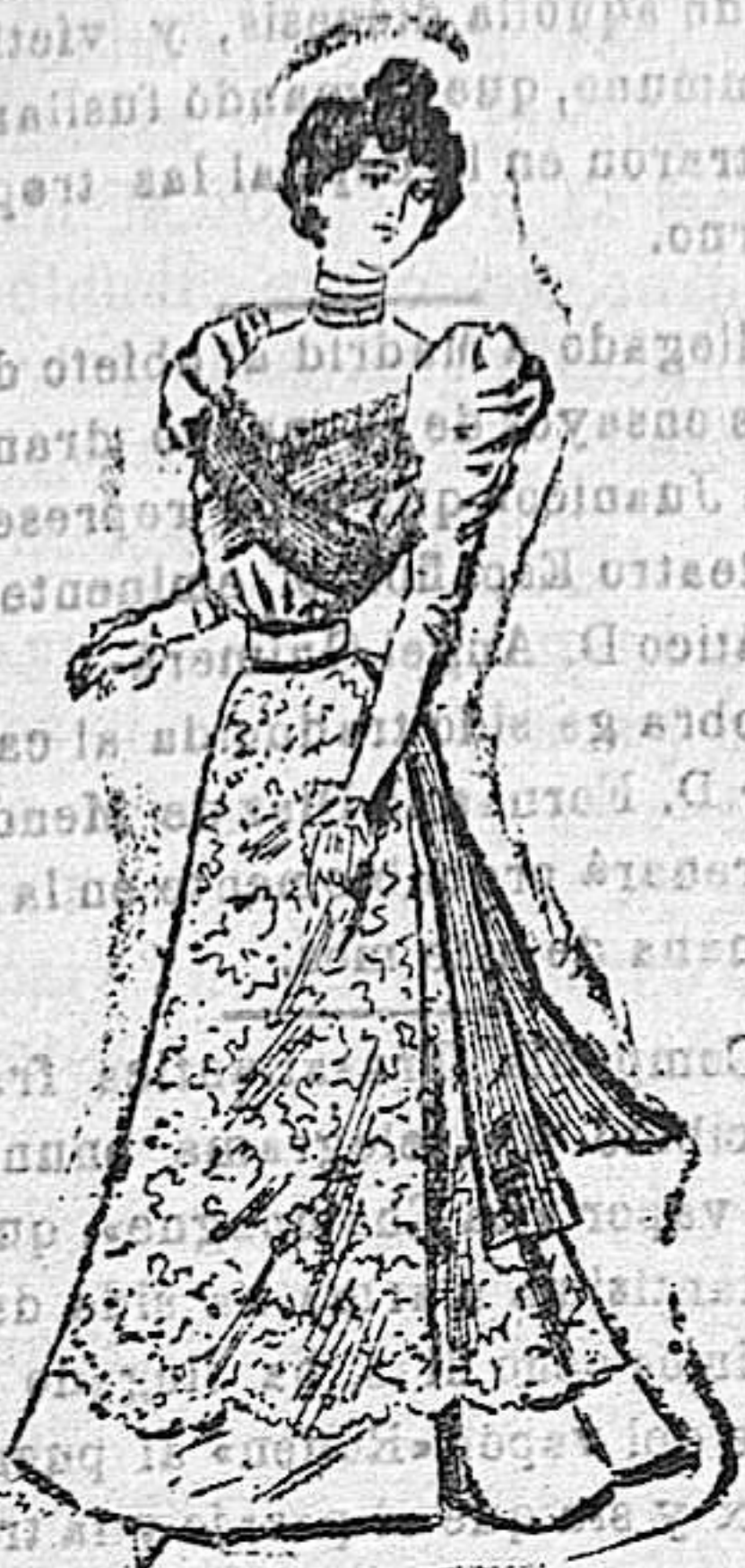
Traje para "garden party."

Cuerpo blusa de guipur sobre un viso tornasol, color lila, adornado con dos cintas alrededor del escote; mangas de guipur; falda de glasé tornasol, color lila, con doblefalda de guipur, y cinturón de cinta con lazada.