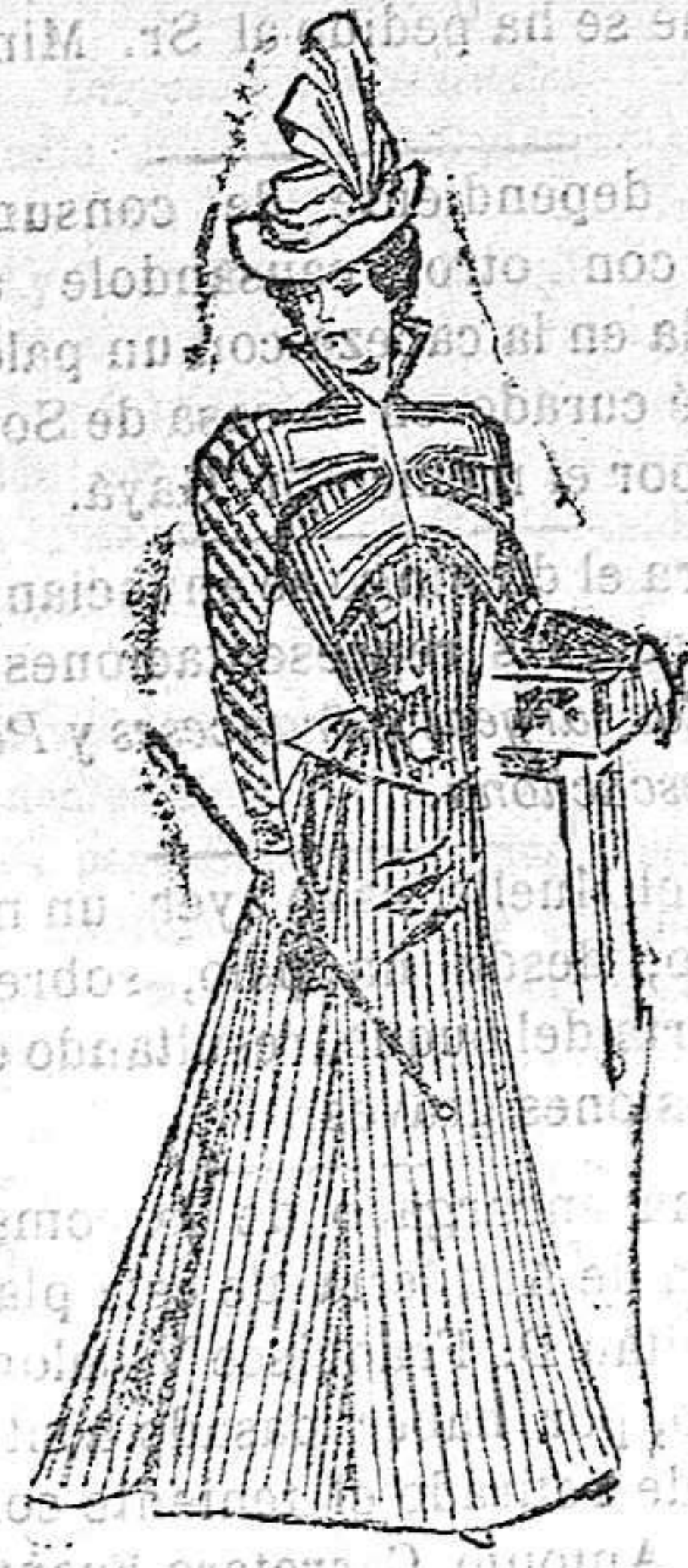
Traje para pase o

De lana. Cuerpo-blusa llevando una tabla en el delantero con botones, y abierta en el centro sobre un plastrón de lana; solapas de terciopelo cubiertas de guipur, dejando ver dos centímetros de terciopelo; cuello alto; mangas de una pieza y falda con dos pliegues detrás cruzados sobre una de las tablas.