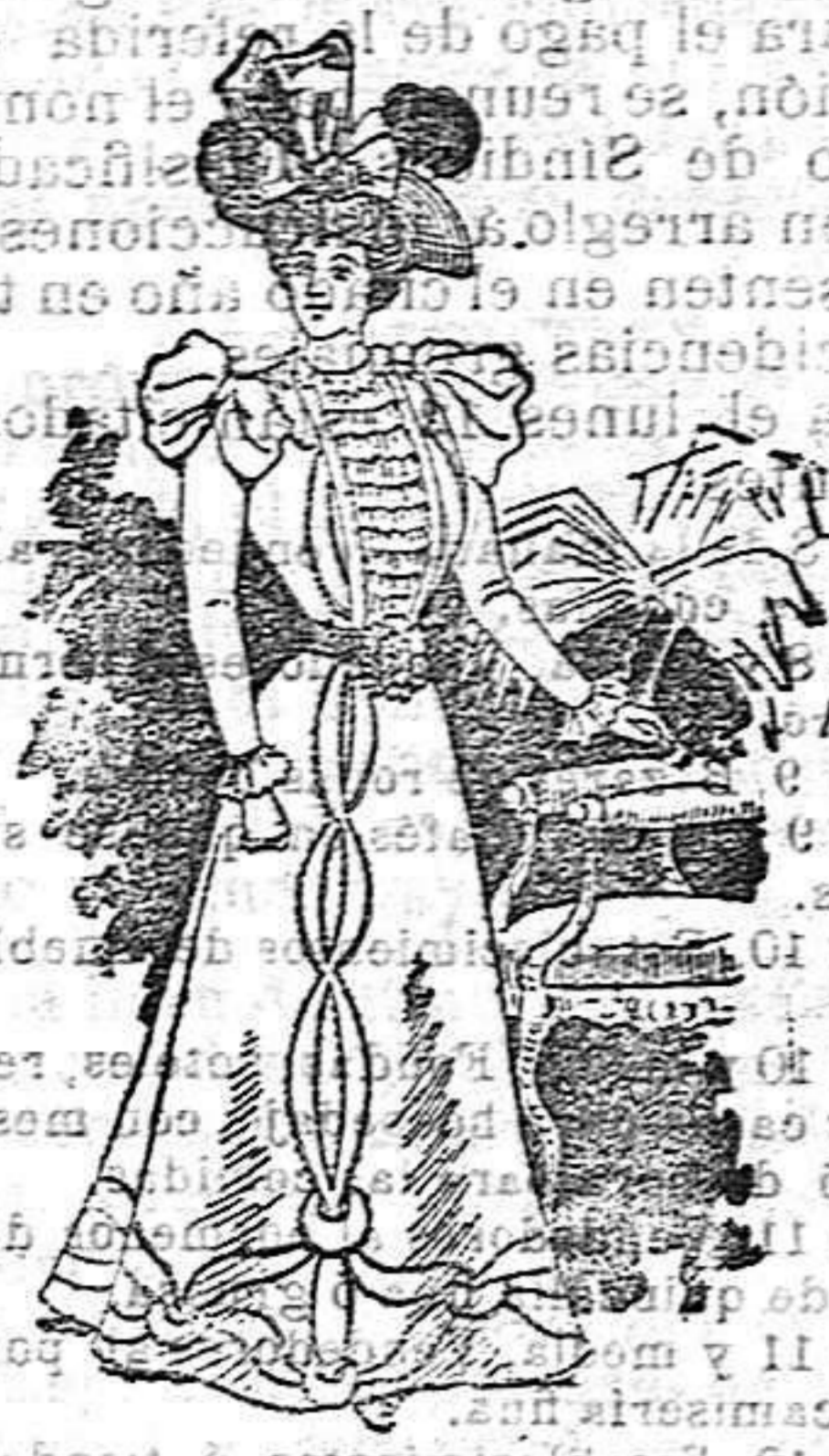
Traje para primavera

Delana, color gris plata; cuerpo entallado adornado y abierto sobre un peto de volantes de seda; cuello bajo con un volante vuelto; mangas estrechas y volante de encaje en la bocamanga. Falda en forma de campana, adornada de seda, color lila y un pequeño encaje en el borde, igual al adorno del cuerpo, formando un bonito dibujo.