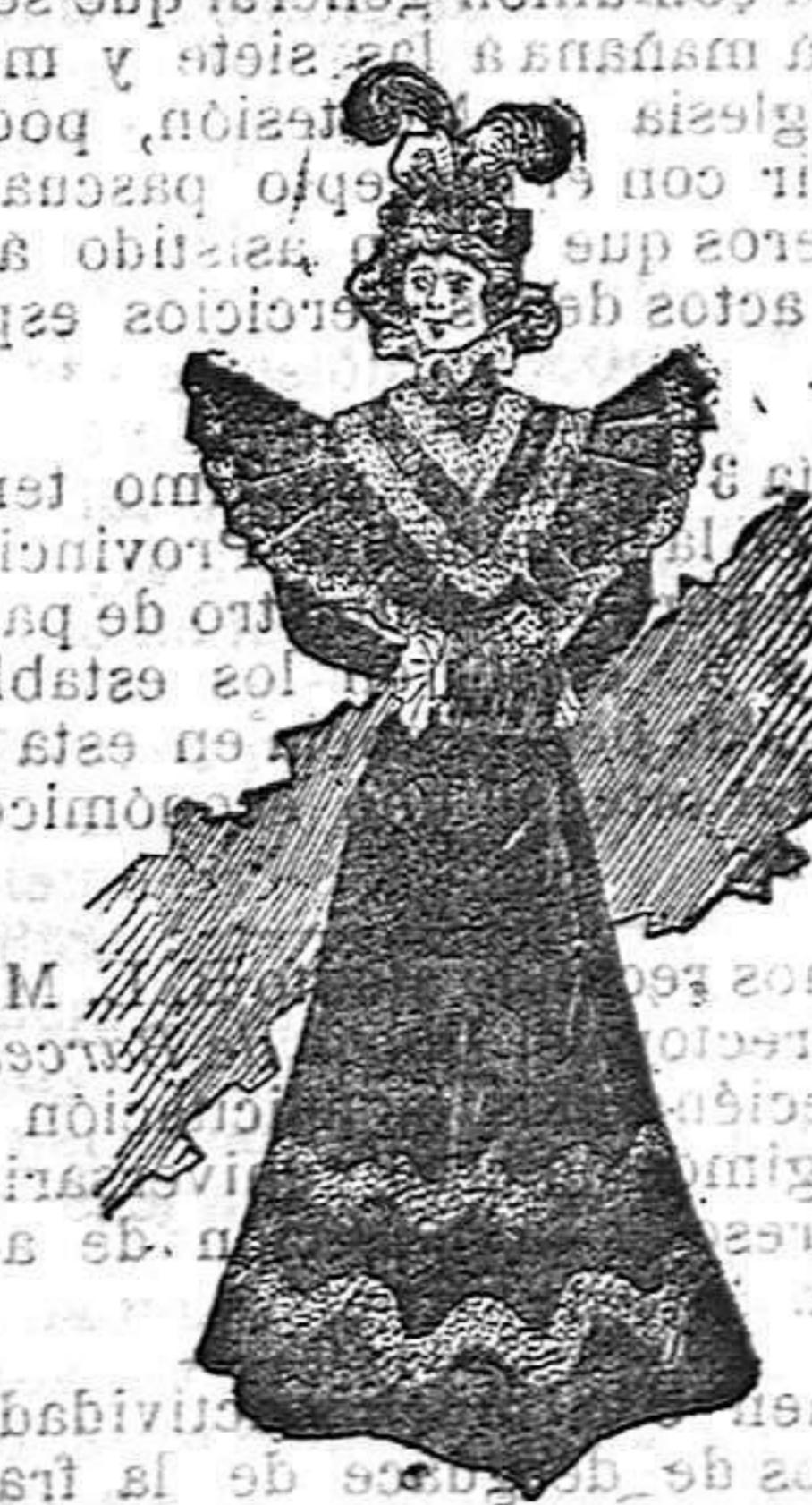
Traje para Iglesia

De pañete. Cuerpo ajustado; cinturón y cuello de terciopelo; chaqueta abierta con solapas bordadas; mangas al biés, también bordadas y faldas en forma de campana, con tres tiras de terciopelo en el borde.