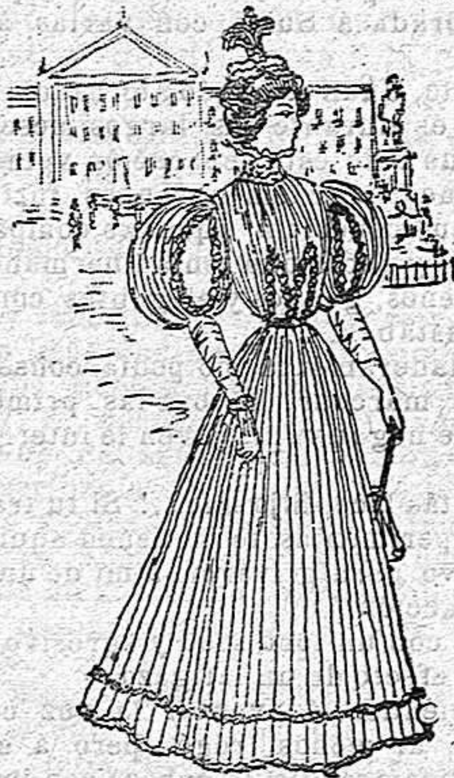
Traje para señorita

De gasa nipa. Cuerpo entallado y plegado acordeón, con viso de seda; delantero de una pieza y abrochado al lado, va áierto, formando V. con una ruxa de cinta de raso del n.º 5 alrededor de la abertura; manga en forma de bullón con paño, áierto el bollo con una ruxa igual á la del delantero; cuello con una gran ruxa de nipa y seda; cinturón de cinta y falda plegada, con dos ruxas de cinta en el borde.