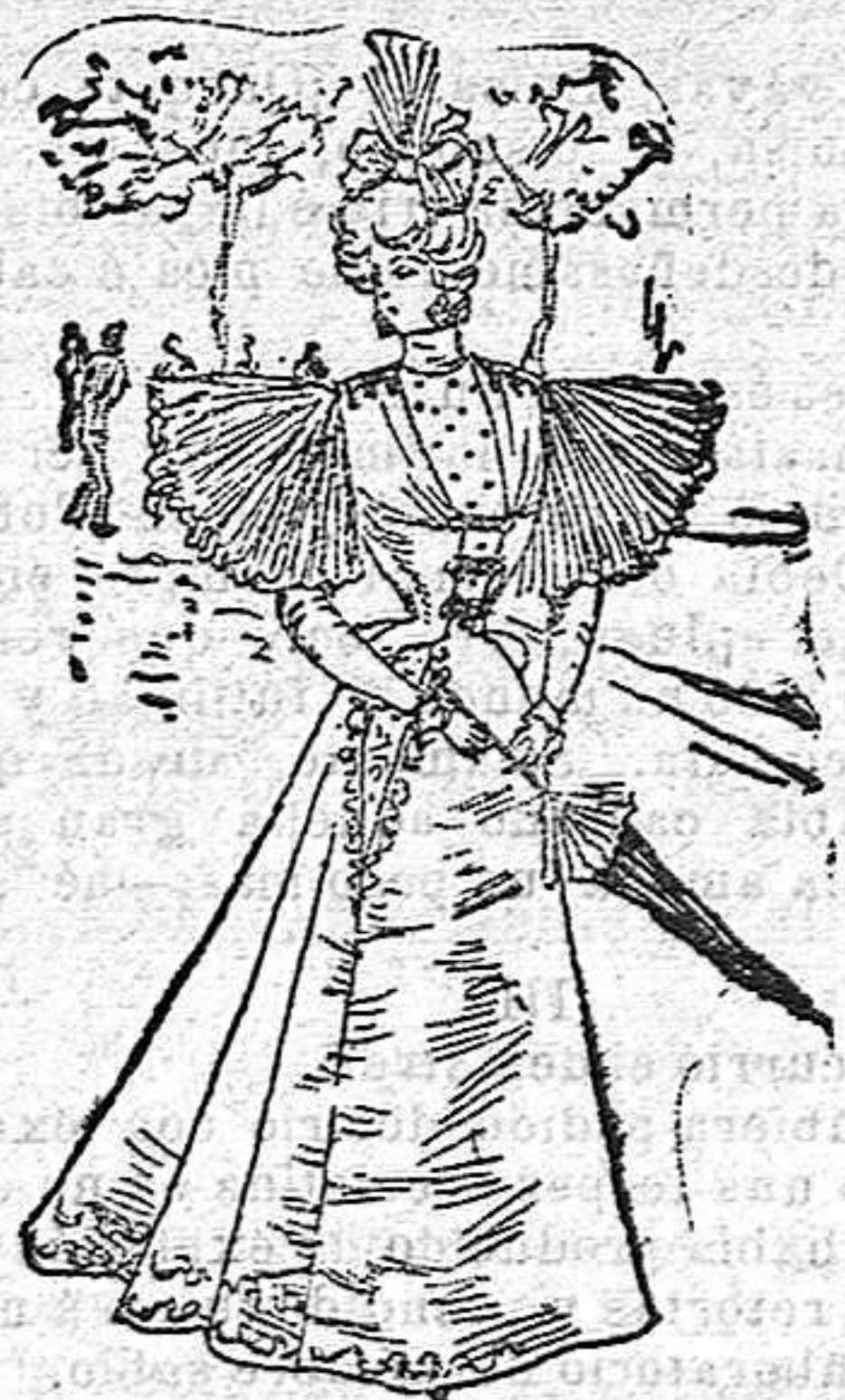
Traje de paseo para señorita

De gasa nipa. Cuerpo entallado y plegado acordeón, con viso de seda; delantero de una pieza y abrochado al lado, va áierto, formando V. con una ruxa de cinta de raso del n.º 5 alrededor de la abertura; manga en forma de bullón con paño, áierto el bollo con una ruxa igual á la del delantero; cuello con una gran ruxa de nipa y seda; cinturón de cinta y falda plegada, con dos ruxas de cinta en el borde.