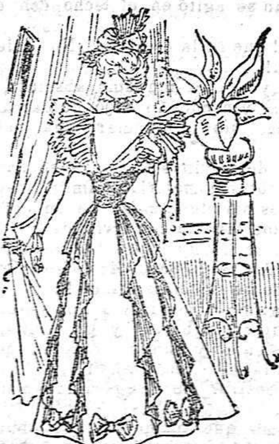
Traje de visita, para señorita

De seda, novedad. Cuerpo ajustado con aldetas acampanadas y abierto en el delantero; lleva tres patitas y botones desde la cintura al pecho, encima de un peto de seaa de diferente color, á topitos, y en los lados va la tela floja y recogida en el pecho, llevando en el hombro unas aplicaciones de bordado de seda negra y en la bocamanga un volante de puntilla valencien. Falda en forma de camgana, con dos quillas abiertas encima, de seda blanca, y bordados de seda; lleva además dos tiras de bordados en el bajo. Cuello alto con dos chús de seda.