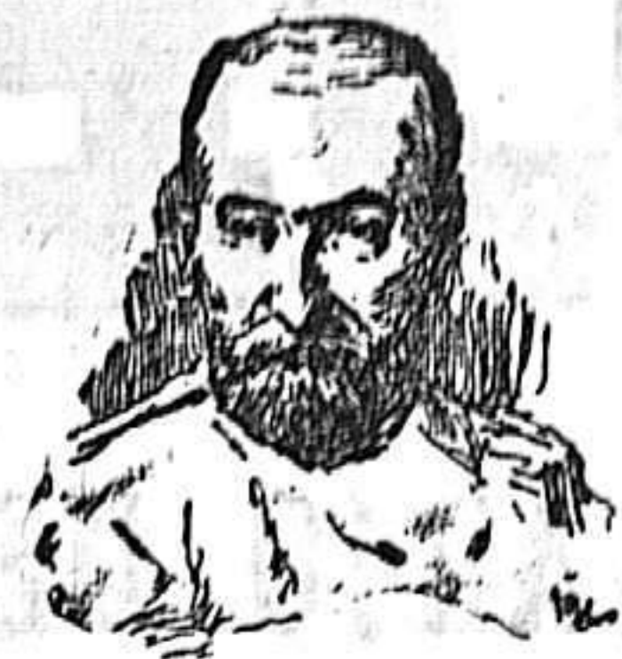
D. Alejandro San Martín

Senador por la Universidad de Madrid, académico de la Real de Medicina, catedrático de Patología Quirúrgica de San Carlos; el señor San Martín se ha distinguido hasta ahora por su amor á la ciencia, y se ha hecho notar por su intervención imparcial y sus ideas acerca de la enseñanza en los debates que, respecto de tan importante cuestión, ha habido dentro y fuera del Parlamento.