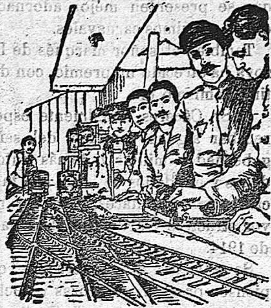
Soldados ingleses estudiando la conducción y guía de los trenes.

Vive de la industria y para la industria, y las conmociones que ella experimenta sufrenlas él igualmente, pere en proporciones acrecentadas de un modo que aterra.