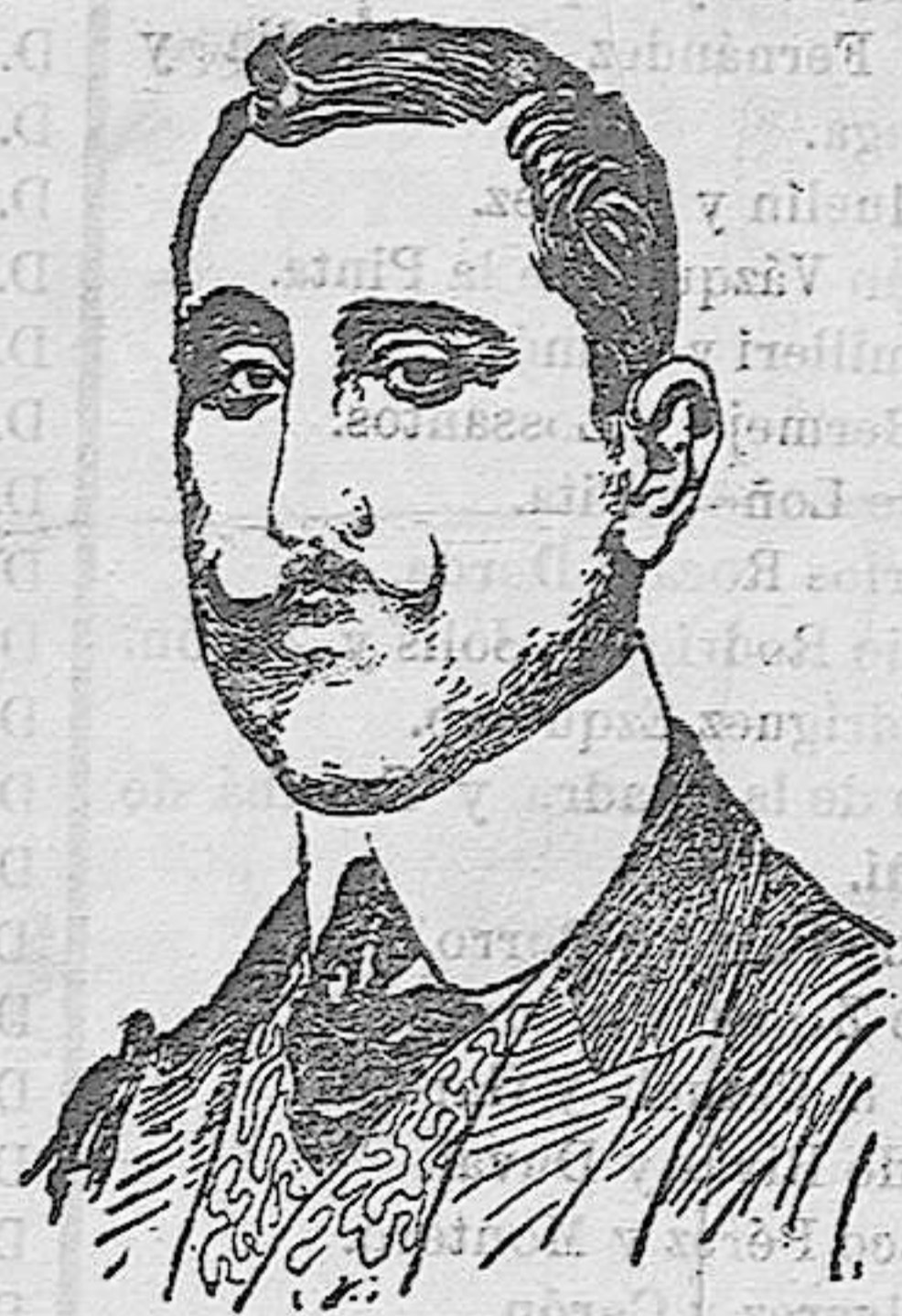
Elegido por la Academia de la Historia en su última sesión para ocupar la vacante de D. Marcelino Menéndez Pelayo.