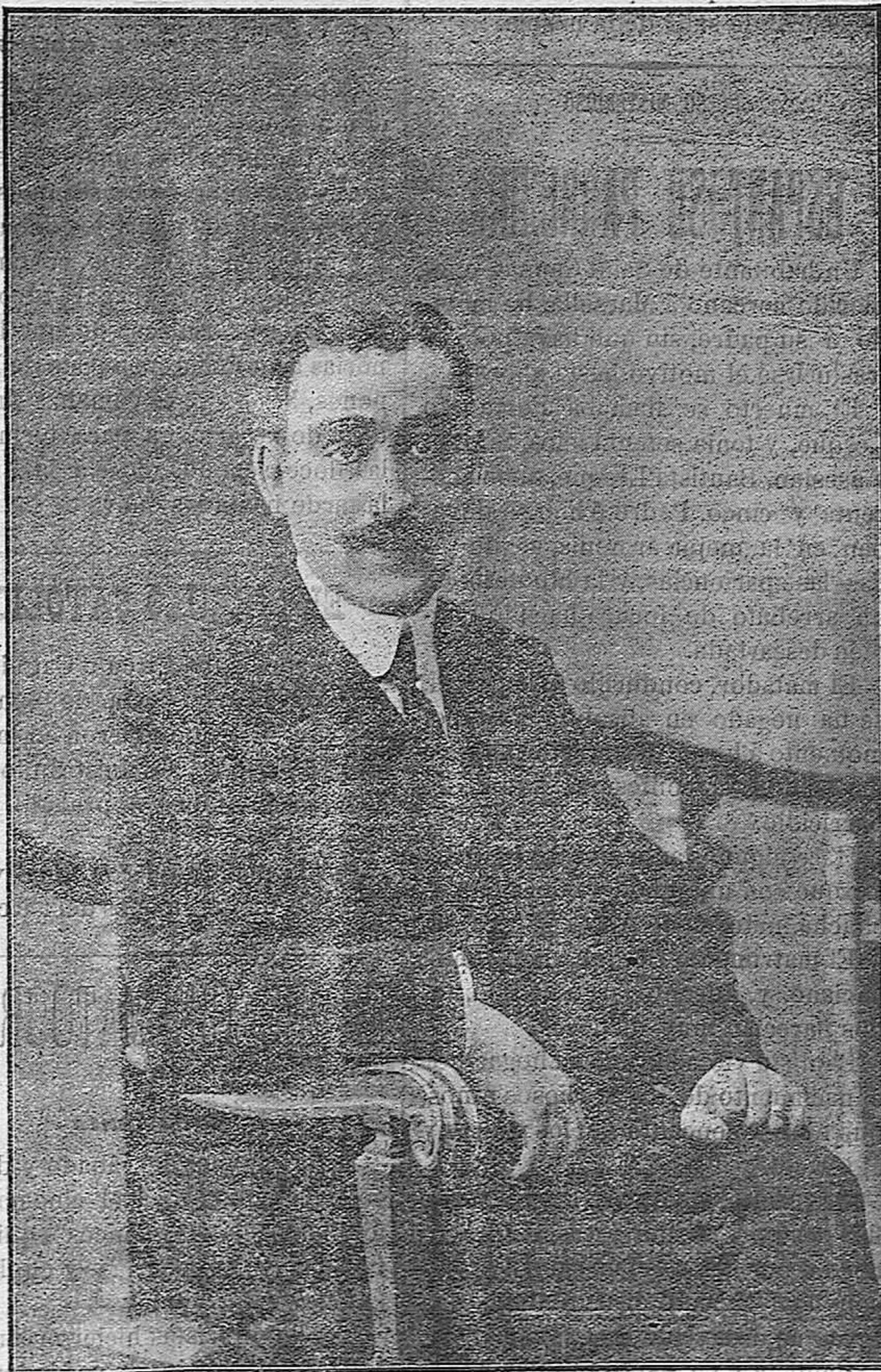
D. José Martínez Velasco

Comenzó el 27 con lo que en la vida política del Sr. Martínez Velasco podría llamarse aquí «apertura de cuenta corriente con sus electores». La primer hoja de las muchas que ha de contener ese gran libro del porvenir de esta tierra, fué autorizada solemnemente con la presencia de tantas comisiones como ayuntamientos hay en el partido, sin faltar uno.