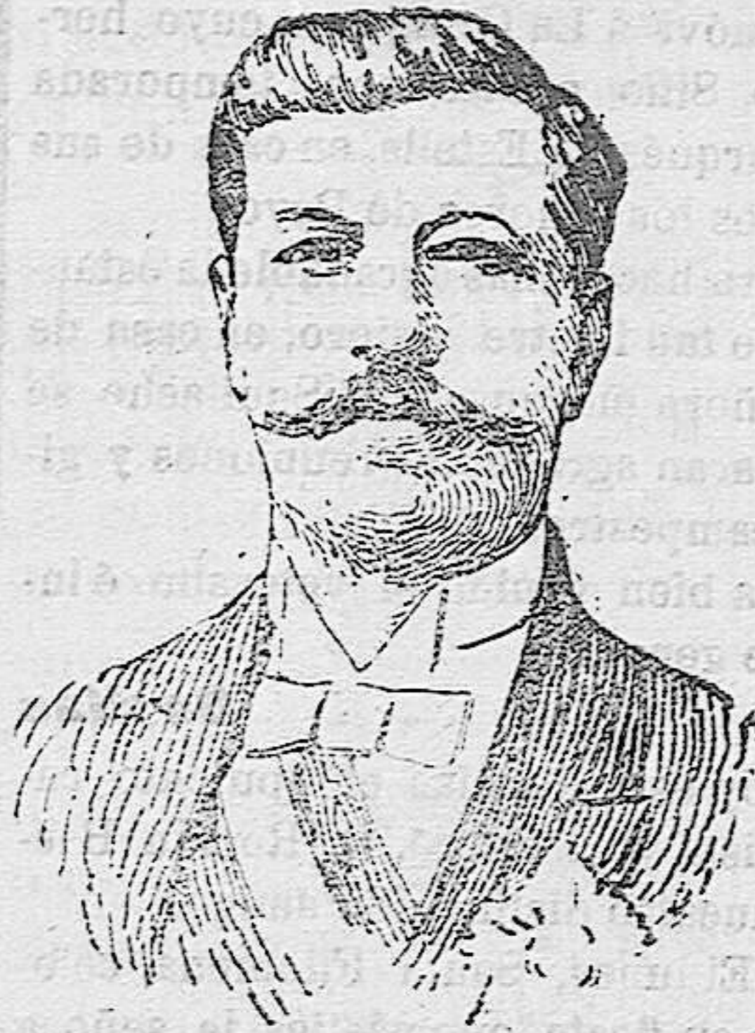
El presidente Gómez

Estos dos famosos venezolanos, actual presidente de la República de Venezuela, el primero, y presidente deposedido, el segundo, se disponen á medir sus armas, dando rienda suelta á sus odios personales.