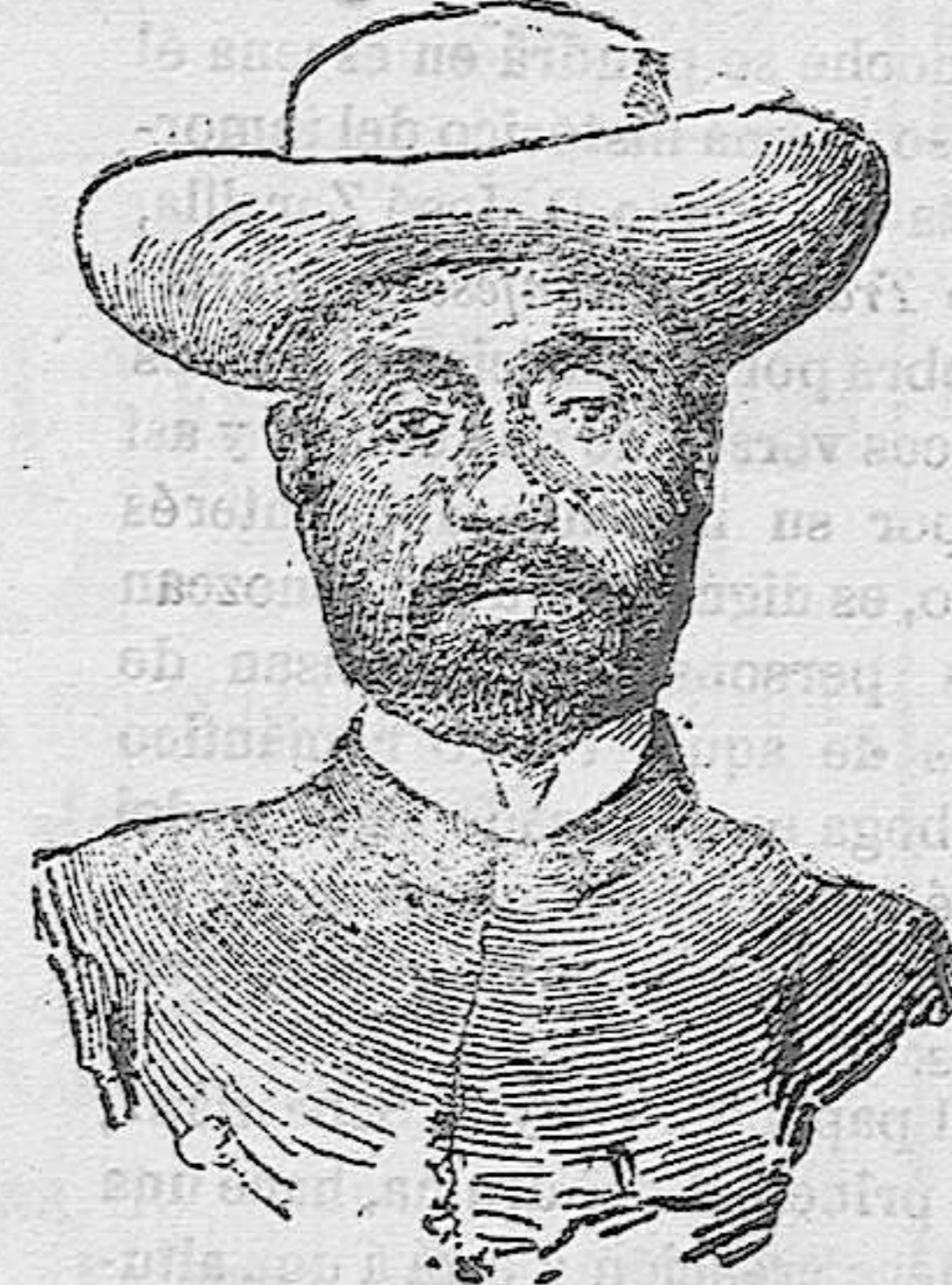
El ex presidente Castro

Según las últimas noticias, Castro ha salido de Coro al frente de 12.000 hombres, no dice el cable si todos ellos son coristas, pero si que van perfectamente armados, lo que acaso