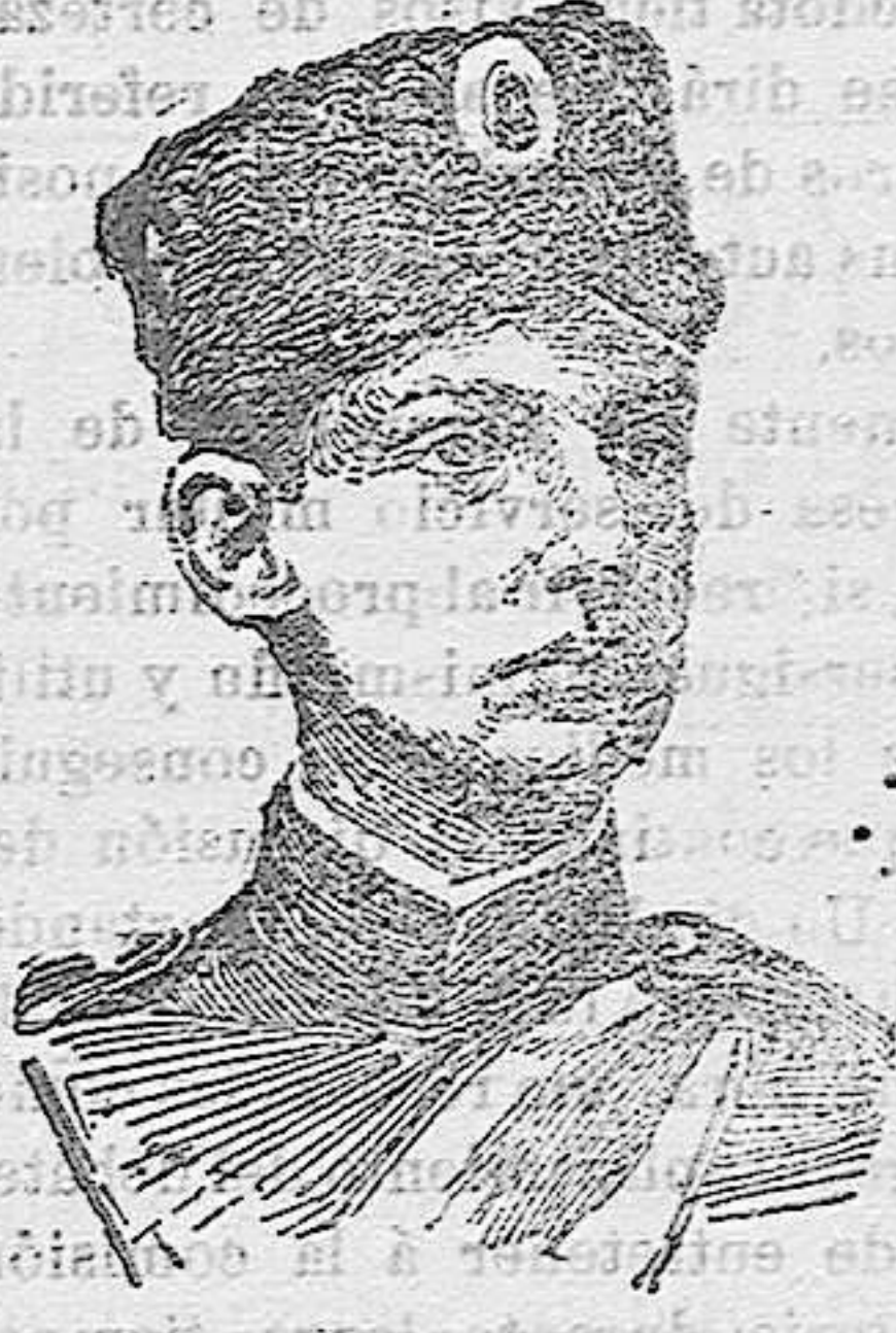
EL PRINCIPE ALEJANDRO

Pese a los buenos oficios de Rusia, en la península de los Balcanes vuelve á tronar el cañón y á escucharse el tableteo de las ametralladoras y de las descargas de fusilería; pero esta vez la lucha no se desarrolla entre combatientes de distinta raza y religión, sino entre hermanos, entre soldados que ha poco se estrechaban en apretado abrazo, y juntos marchaban á vencer generosamente su sangre y juntos celebraban la victoria.