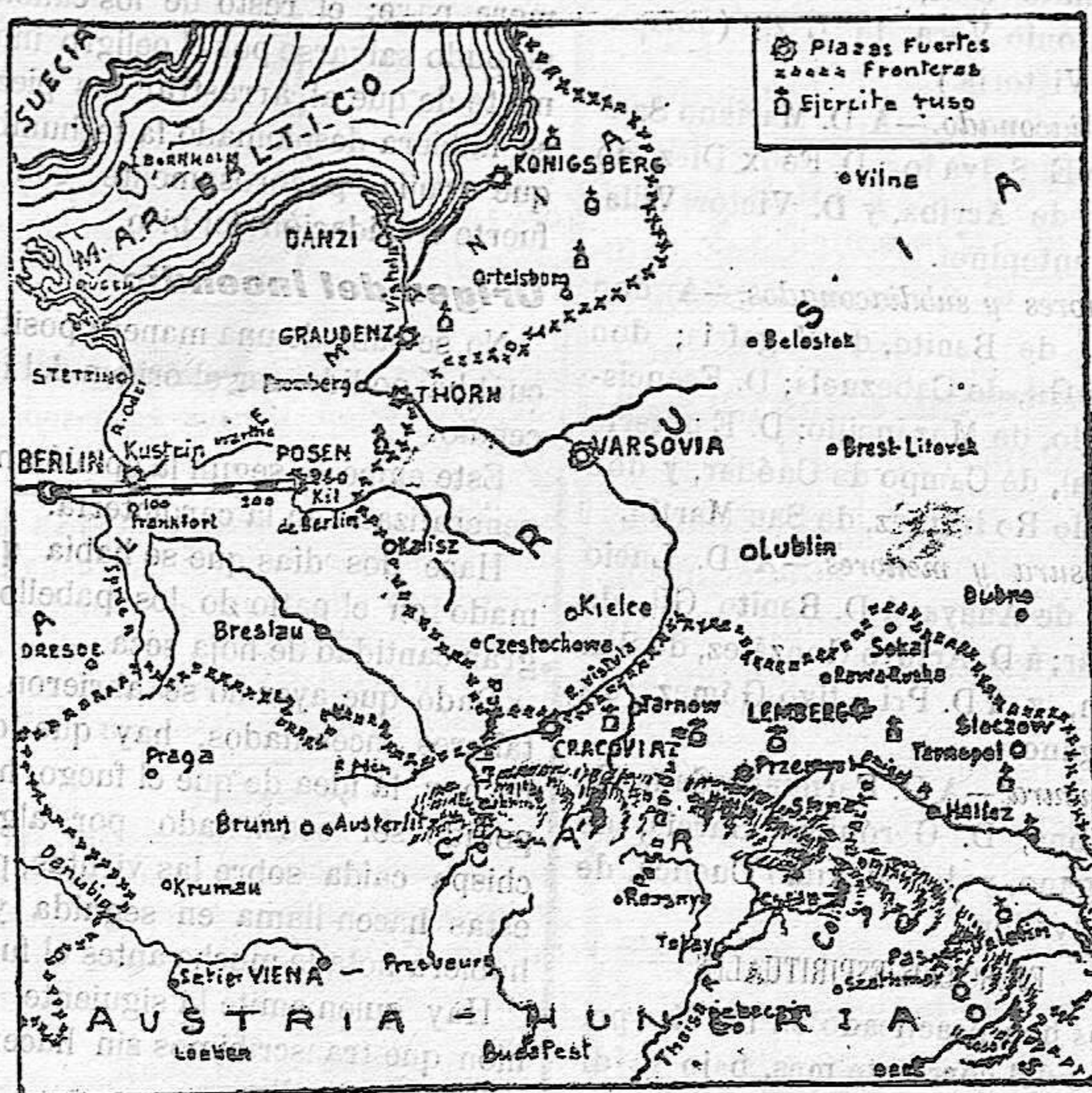
Gráfico del avance ruso en Alemania y Austria-Hungria.

Se ignoran los móviles que impulsaron a Serrano a cometer este horrendo crimen.