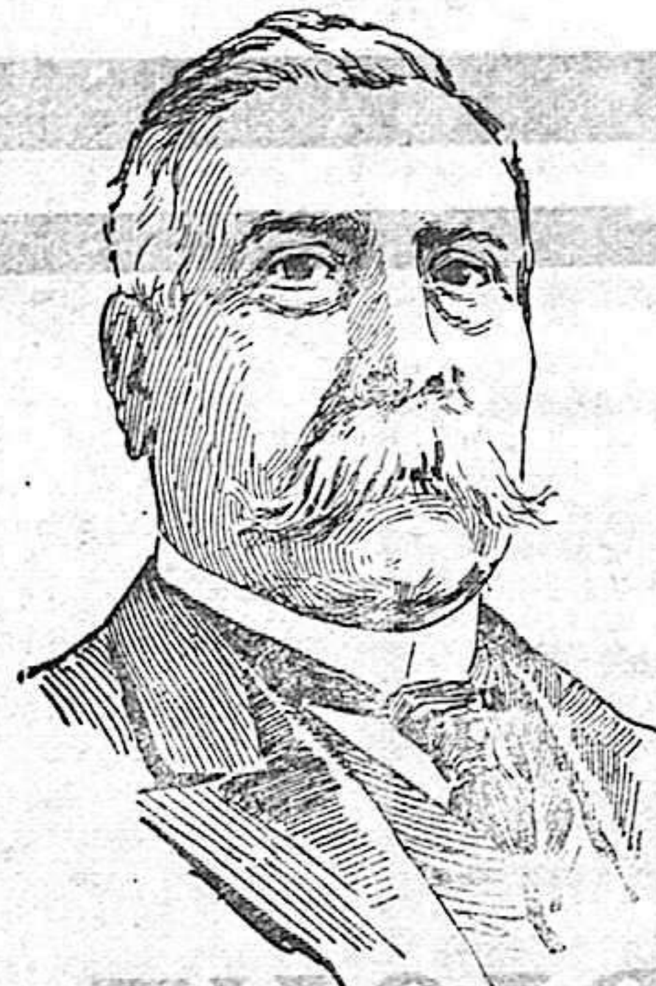
Ex presidente de la República de Méjico, recientemente fallecido en París.