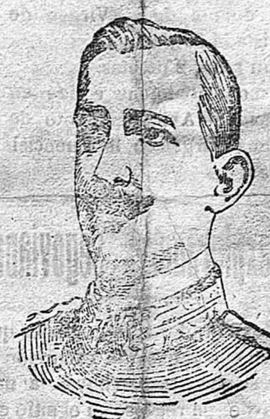
El duque de Aosta comandante del ejército italiano que se ha apoderado de la plaza fortificada de Gorizia.