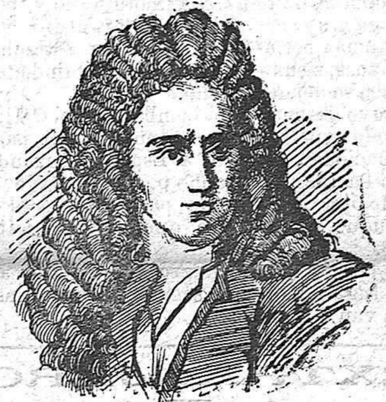
14 de Abril de 1682 Nace el pintor Van-Huysum

Juan Van-Huysum, cuyo retrato publicamos hoy, nació en Amsterdam. Su padre, Justo Van-Huysum, era pintor de historia, de retratos, de batallas, de marinas ó de flores, con la particularidad (añade Descamps) de que este pintor cultivó todos esos géneros sin ser mediocre en ninguno.