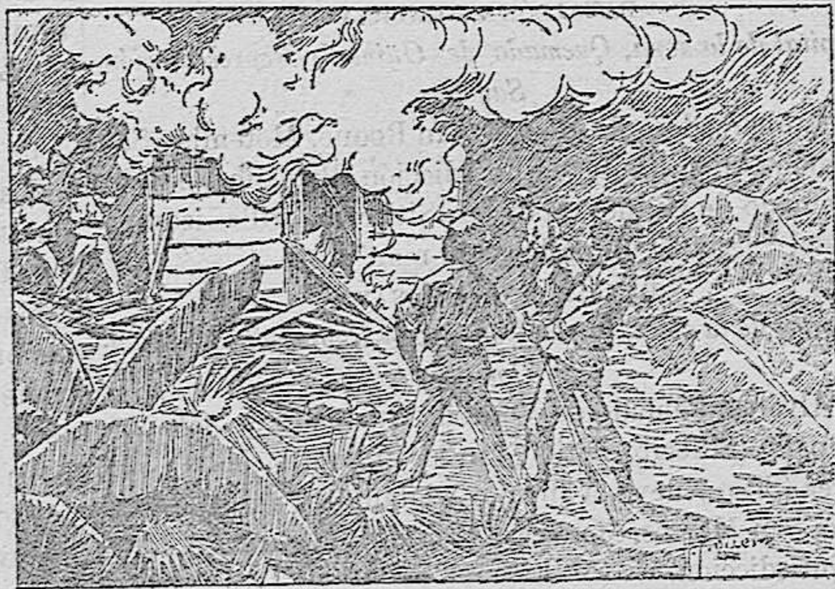
Barraca incendiada por los insurrectos