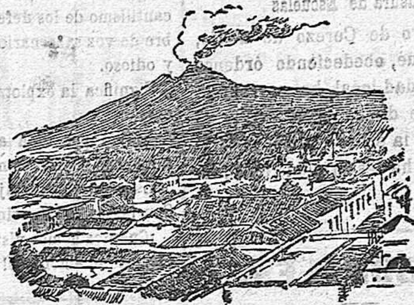
Colima.—La ciudad y el volcán.

Las recientes catástrofes ocurridas en México a consecuencia de repetidos temblores de tierra, dan en estos días triste actualidad a las ciudades de Colima y Chilpancingo, que han sido los puntos más castigados por el terrible fenómeno.