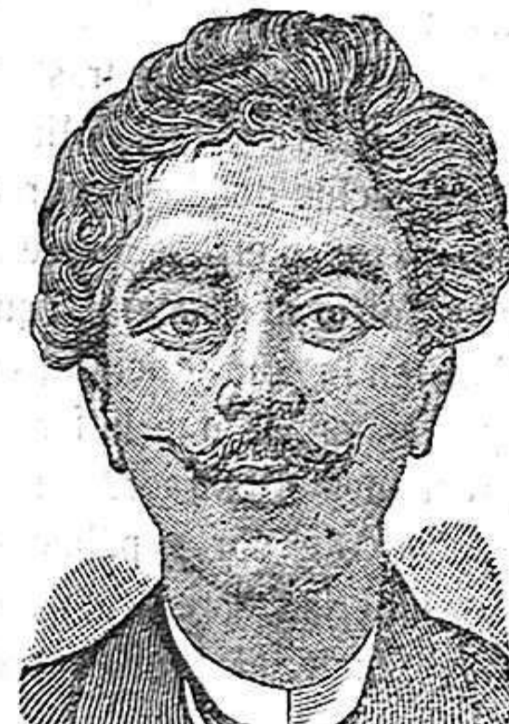
15 días después de tratamiento