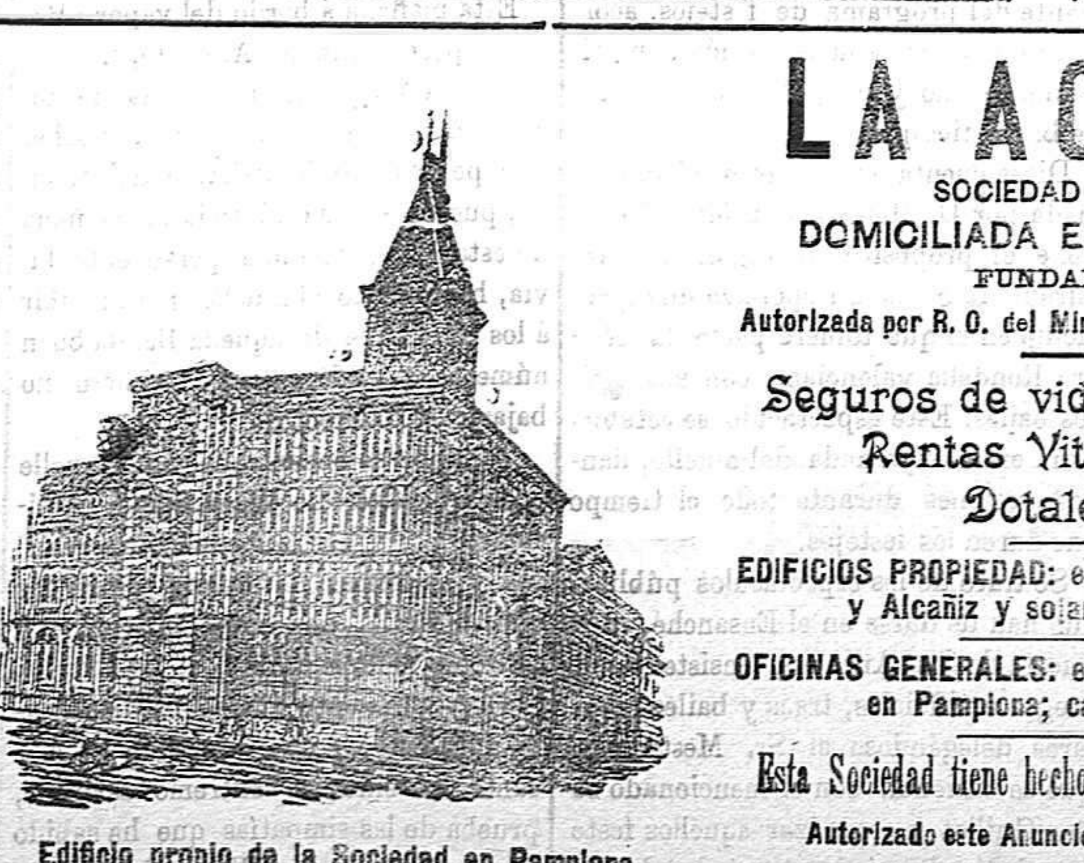
Edificio propio de la Sociedad en Pamplona

Estirpa rápidamente, sin color ni molestias, los puntos de la ropa manchados por el agua, el sudor, el aceite, etc. Nota: no aplica una peseta en todas las farmacias, droguerías y papeterías.