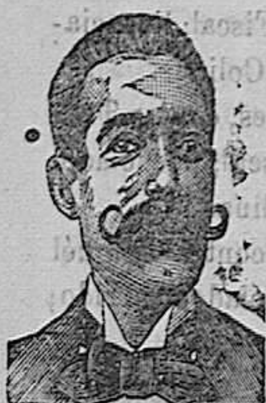
A. SALVATI COSTANZI Calle Diputación, 435 BARCELONA.