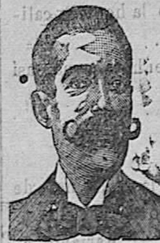
A. SALVATI COSTANZI Calle Diputacion, 435 BARCELONA.

QUEZARAL DIGESTIVO del Dr. CARCOLLER, maravilloso remedio para curar todas las indisposiciones del estómago e intestinos, sean ó no del rosas, PRONTO Y RADICALMENTE. Los enfermos que prueben una vez este prodigioso remedio desechan todos los conocidos hasta el día por muy en uso que estén. SORPRENDEN SUS RESULTADOS. El enfermo crónico que su estómago no le admita más que leche, debe probarlo, comerá bien y dirá mejor. PRECIO, 3 Y 5 PESETAS CAJA. Farmacia de Santo Domingo. Preciados, 35, y García Capellanes, 1, Madrid.—Señores Merino y Viñata de Chalanzon y Sobrino, en Leon, y principales Farmacias y Droguerías de España.