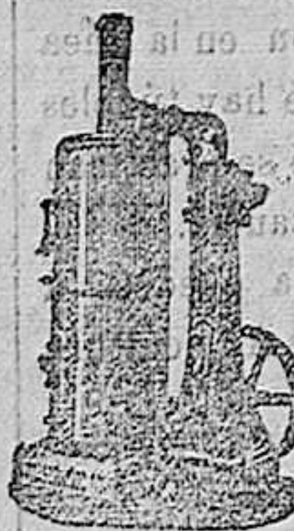
Maquinas a vapor verticales

Maquinas de vapor, Bombas, Prensas, Tubos de todas clases