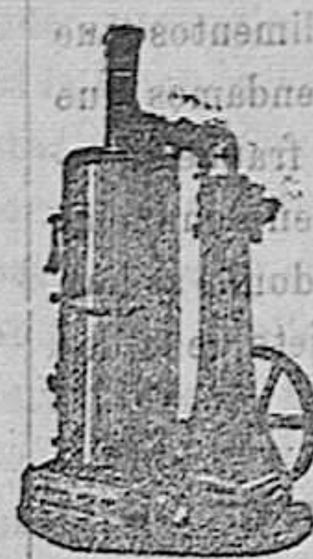
maquinas de vapor verticales