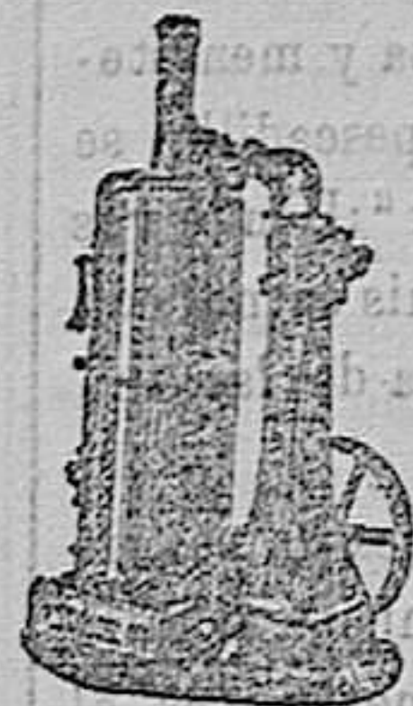
maquina de vapor vertical

Maquinas de vapor, Bombas, Prensas, Tubos de todas clases