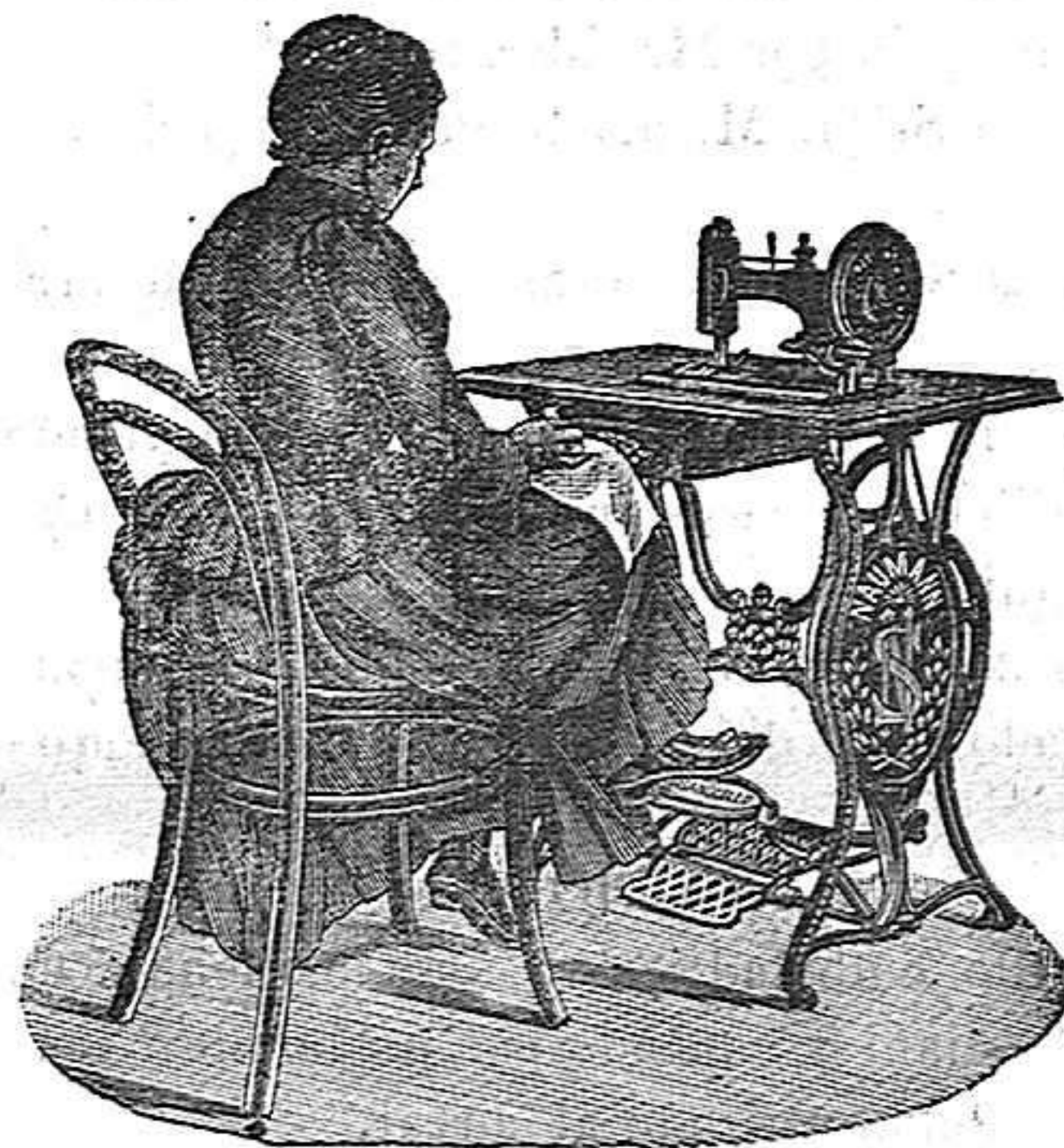
Nuevo, Práctico Higiénico