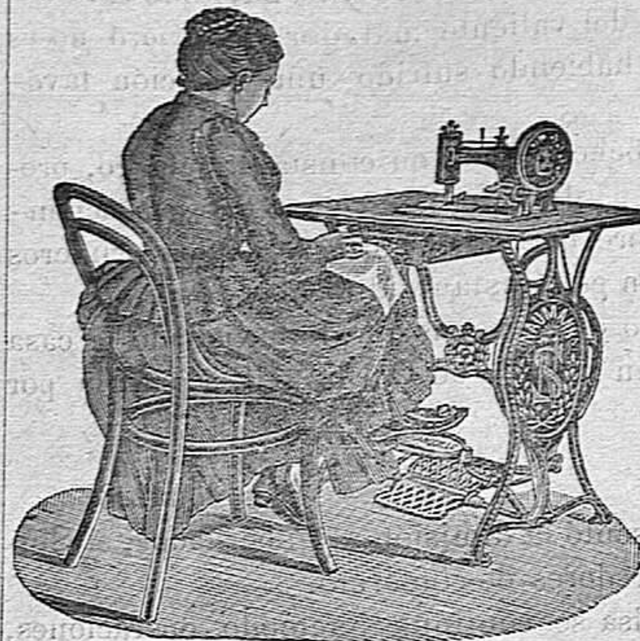
Nuevo, Práctico, Higiénico