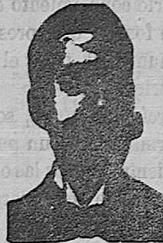
Angelo Costanzi Diputación, 435, et.º Barc.º

ó inyección antivéneera Costanzi. —y roob antisifilítico—