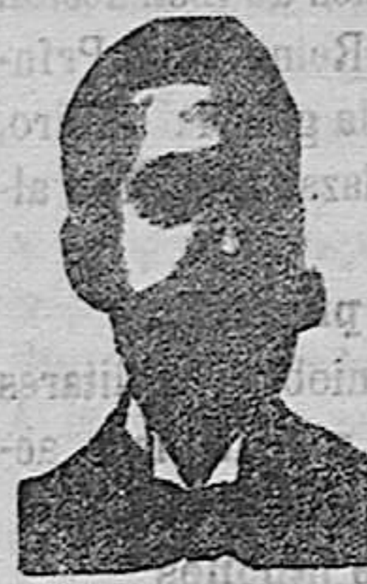
Angelo Costanzi Diputación, 435, et. Barc.

de V. Muñoz. Únicas reguladoras de las funciones digestivas. Laxantes y purgantes. Evitan cólicos y congestiones. Desalojan la bilis y cálculos hepáticos. Combaten el estreñimiento y despejan la inteligencia.—Venta: Trafalgar, 29, botica, quien envía por correo al mismo precio.—En Segovia, Sr. Llovet, Escuderos, 4.—Pedid cajas metálicas. Hay también de caja UNA peseta.