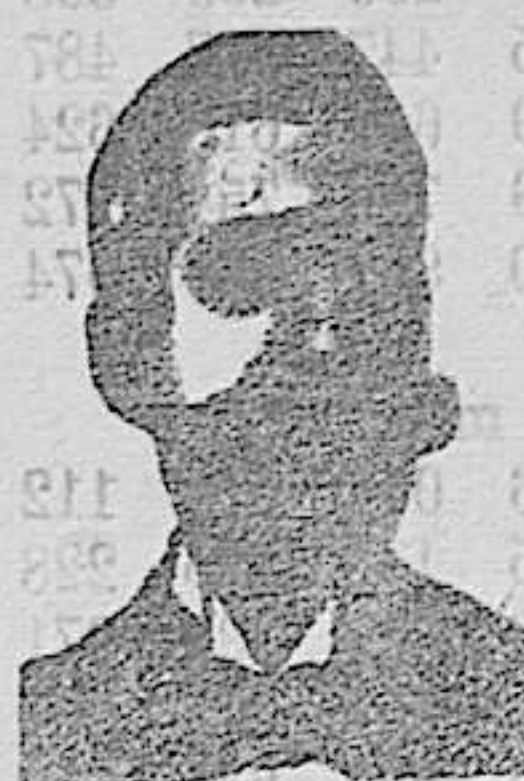
Angelo Costanzi Diputación, 435, et.º Barc.º

En la librería de este periódico se vende toda la modelación y formularios para la riqueza urbana, rústica y pecuaria, y con arreglo al último modelo publicado en el «Boletín Oficial.»