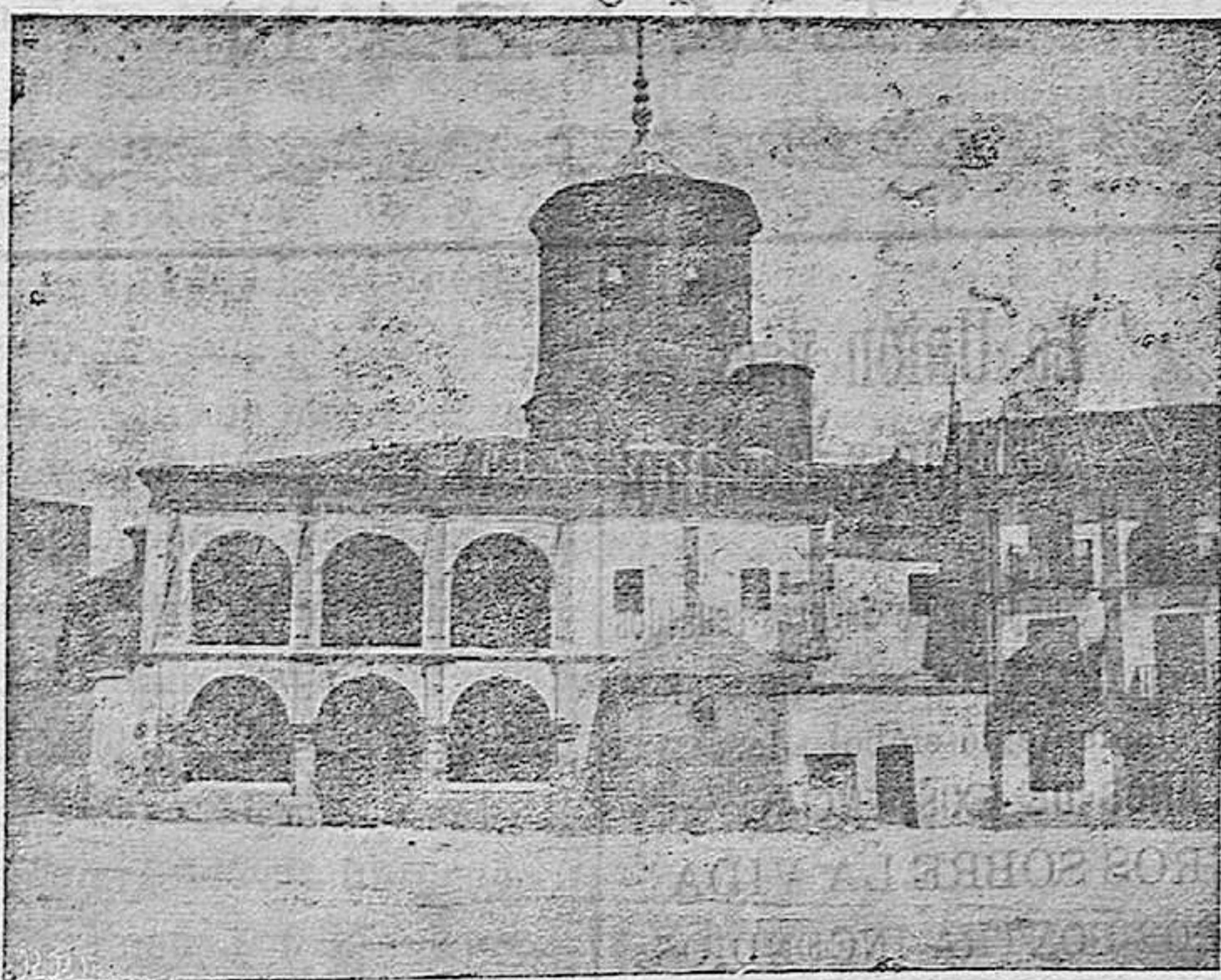
Plaza Mayor.—Iglesia de San Miguel.

SORIA.—Imprenta de Fermín Jodra Plaza Mayor, 14, planta baja.