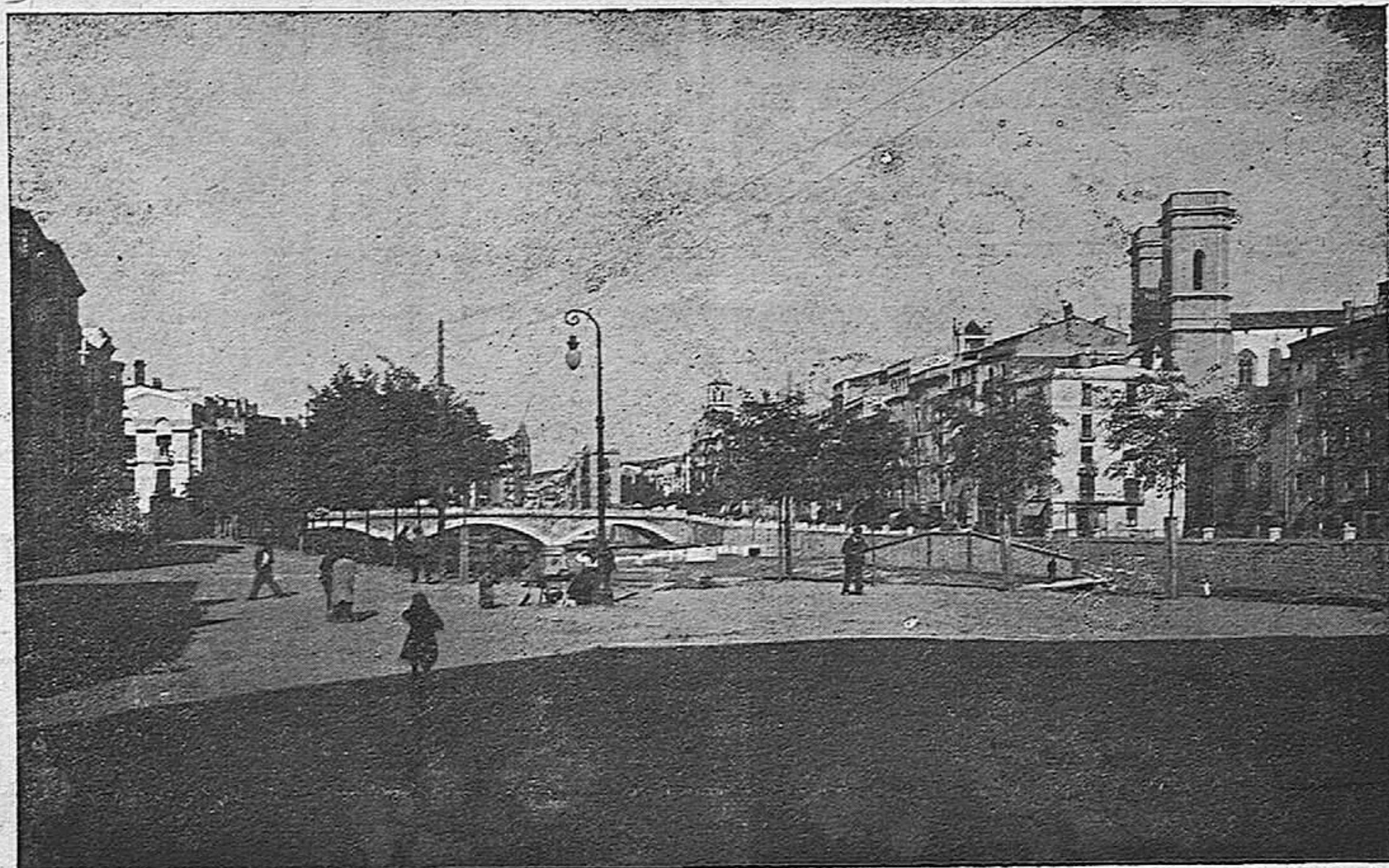
Rambla de Pi i Margall.—GERONA.