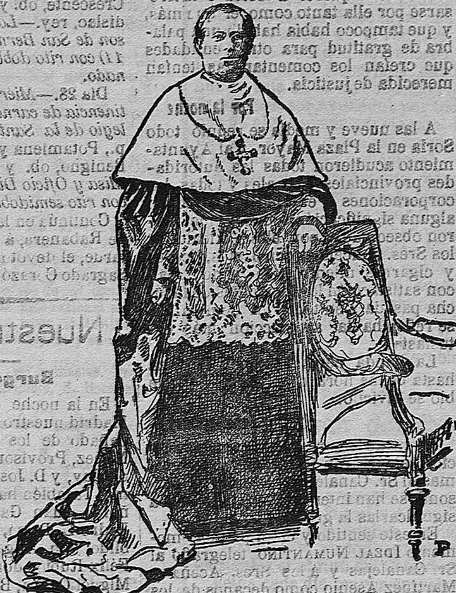
El Obispo de Namur

Presidente General de los Congresos Eucarísticos