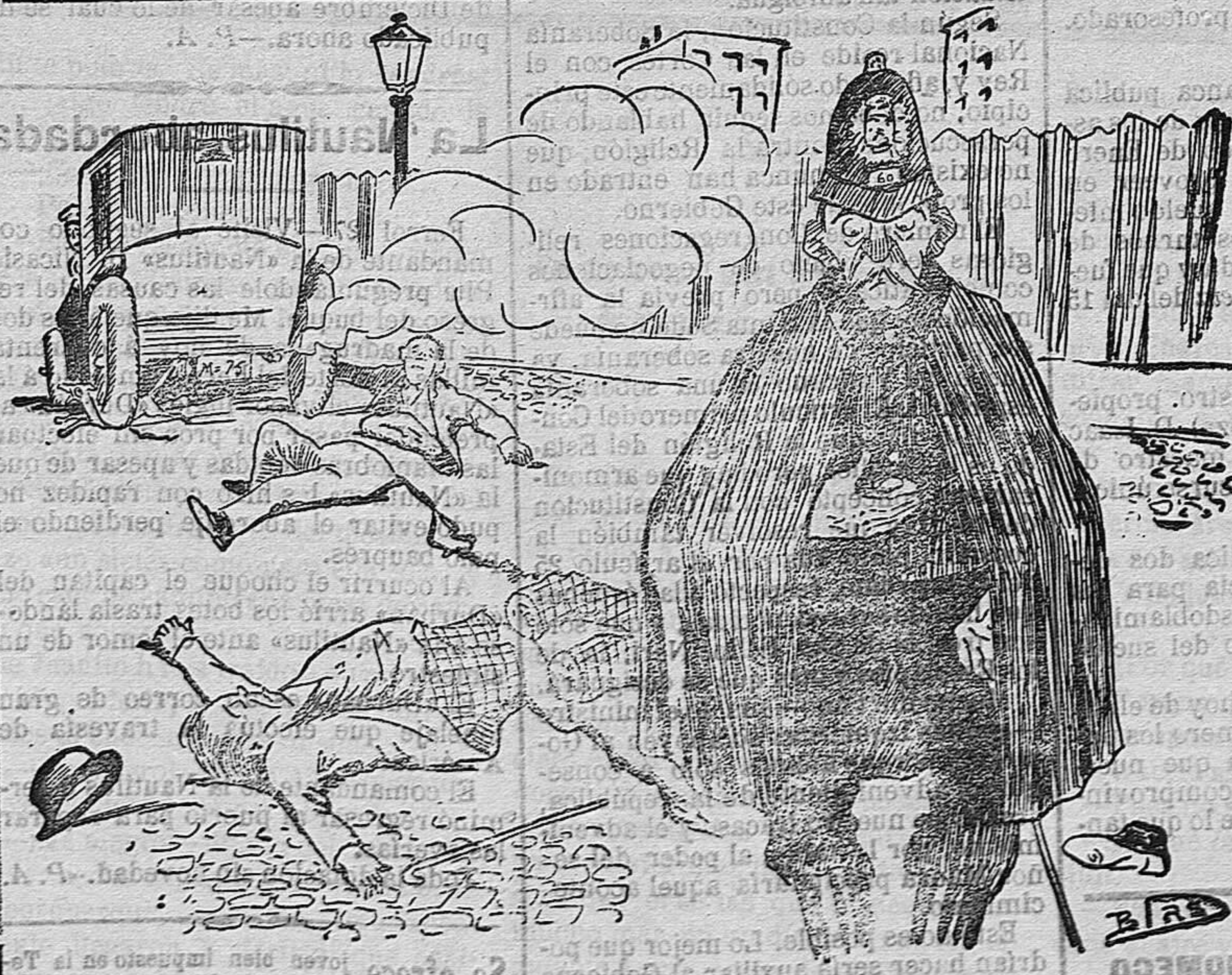
Gracias á estos nuevos aparatos facilitados á la policía, si no se consigue evitar los atropellos, al menos se puede saber á qué velocidad atropellan los autos... ¡que ya es un consuelo!

II Yá sólo se escucha, segura y constante, la voz de la Iglesia decir en lenguaje severo al cristiano: —Las bromas y bailes