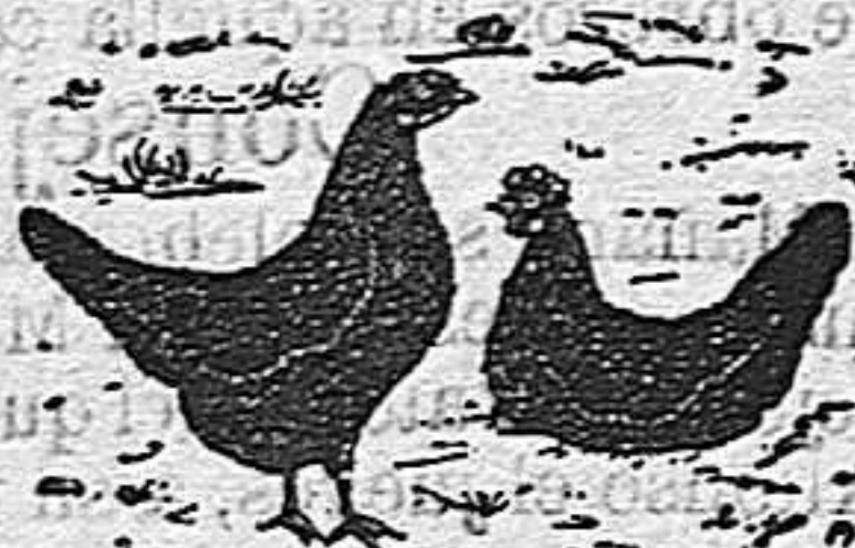
MARCA DE FÁBRICA REGISTRADA