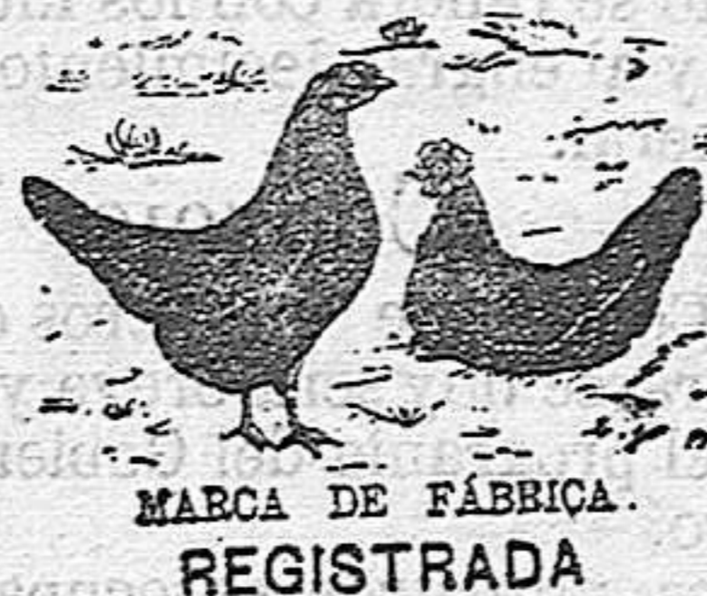
MARCA DE FÁBRICA REGISTRADA

para hacer poner á las aves (gallinas, patos, ánades, etc., etc.)