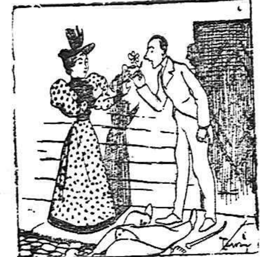
¡Toma! ¡Pobrecillo! Matarse en la flor de su vida.