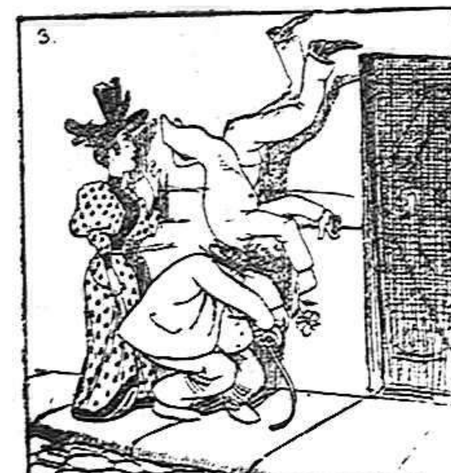
—No me olvidéis, Aurora, porque no podría resistir tan rudo golpe...