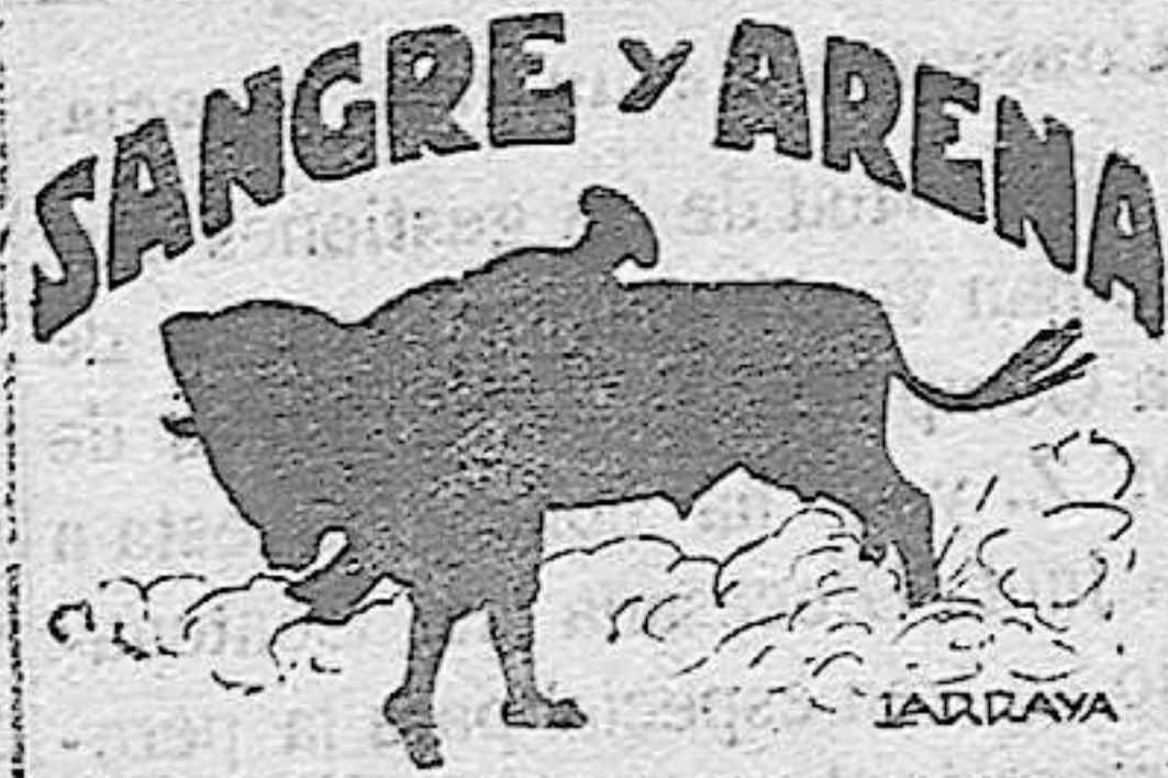
Las de Puertollano.

Detalles y precios en carteles de m. no.—La Empresa gestiona trenes especiales de las Compañías de Valdepeñas a Puertollano y Puertollano a San Quintín.