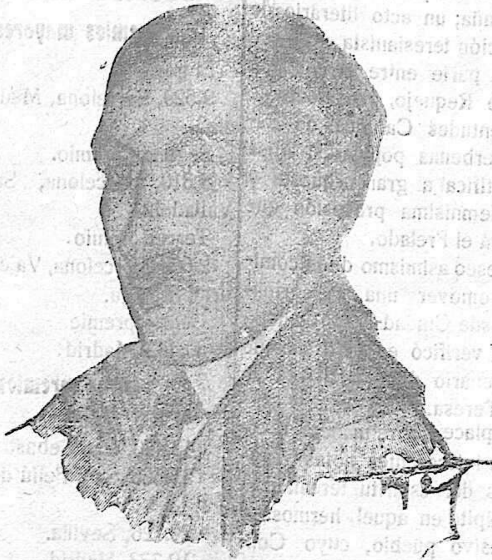
Secretario de Redacción de la revista «Cosmópolis» y de la «Editorial Mundo Latino»