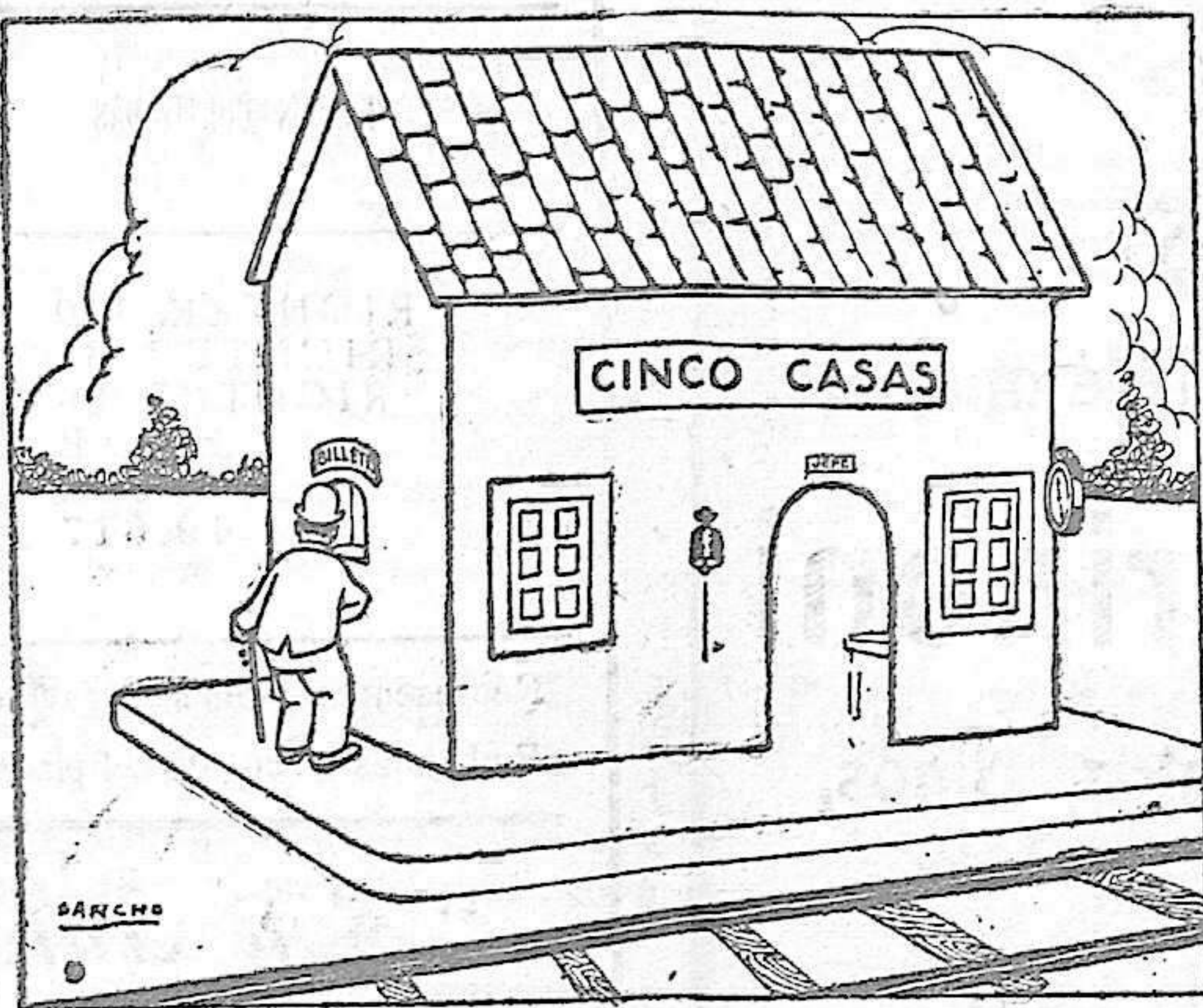
¿Sacando el dinero... ó metiendo el billete?

Ya no habrá «colonias» en la península que seguir explotando. Adios ilusiones, adios esperanzas. Ya no habrá jueces íntegros que exclamen; «no puedo.... no me es posible». Vendrá la quiebra de todos los vividores políticos, pero ya estaba antes declarada la de la justicia. ¡Qué sarcasmo!