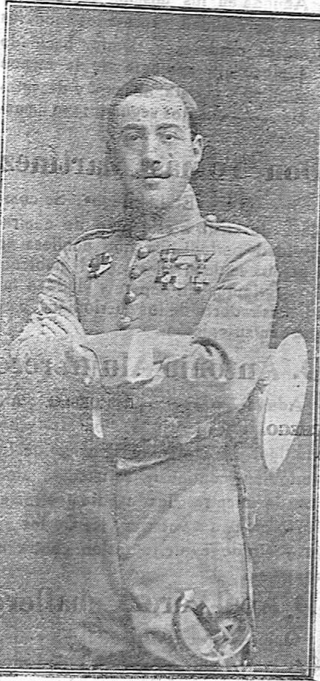
D. Arsenio Martínez de Campos