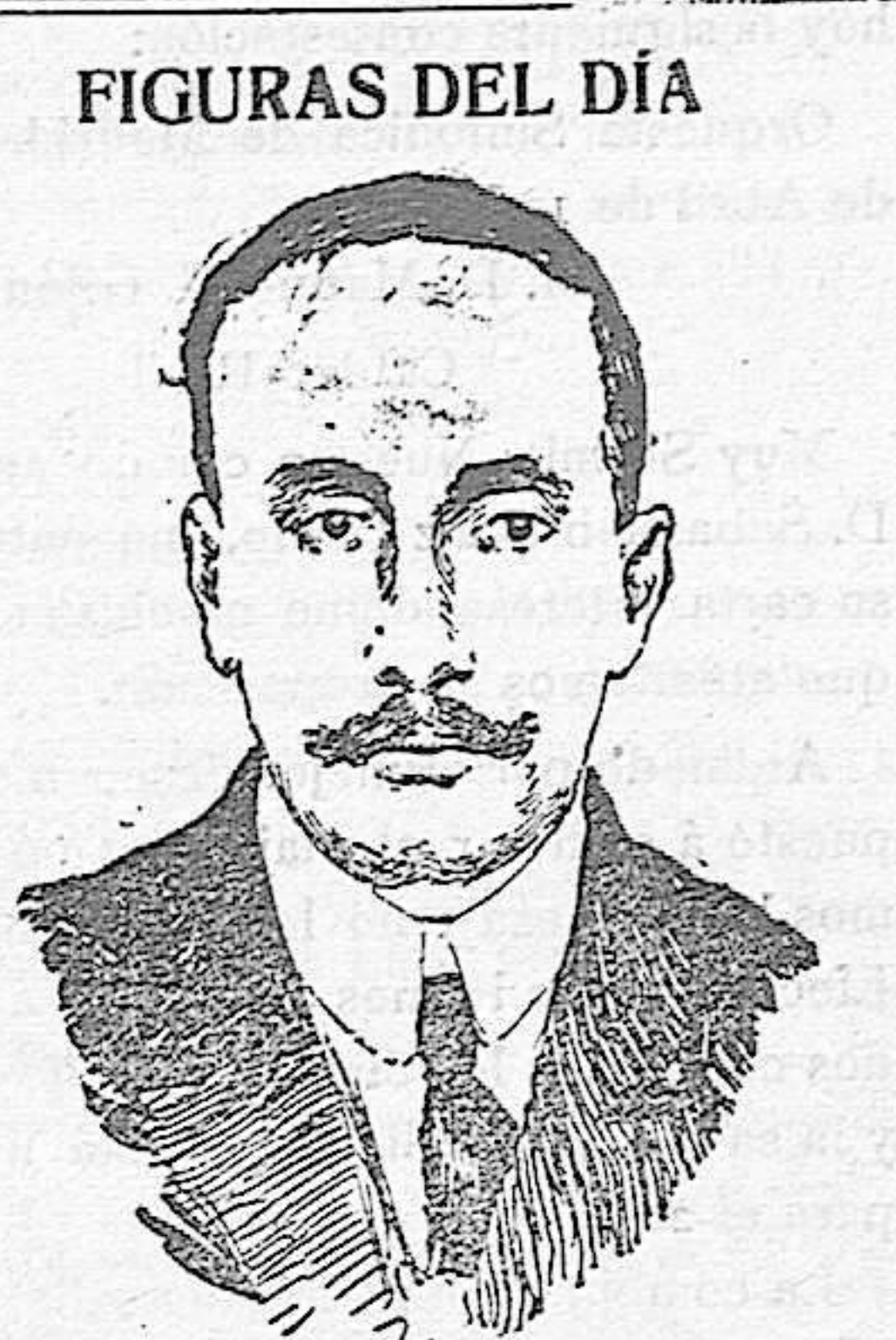
El ex-ministro D. Juan Ventosa, que en breve marchará a Berlin con una importante misión del Sr. Cambó.