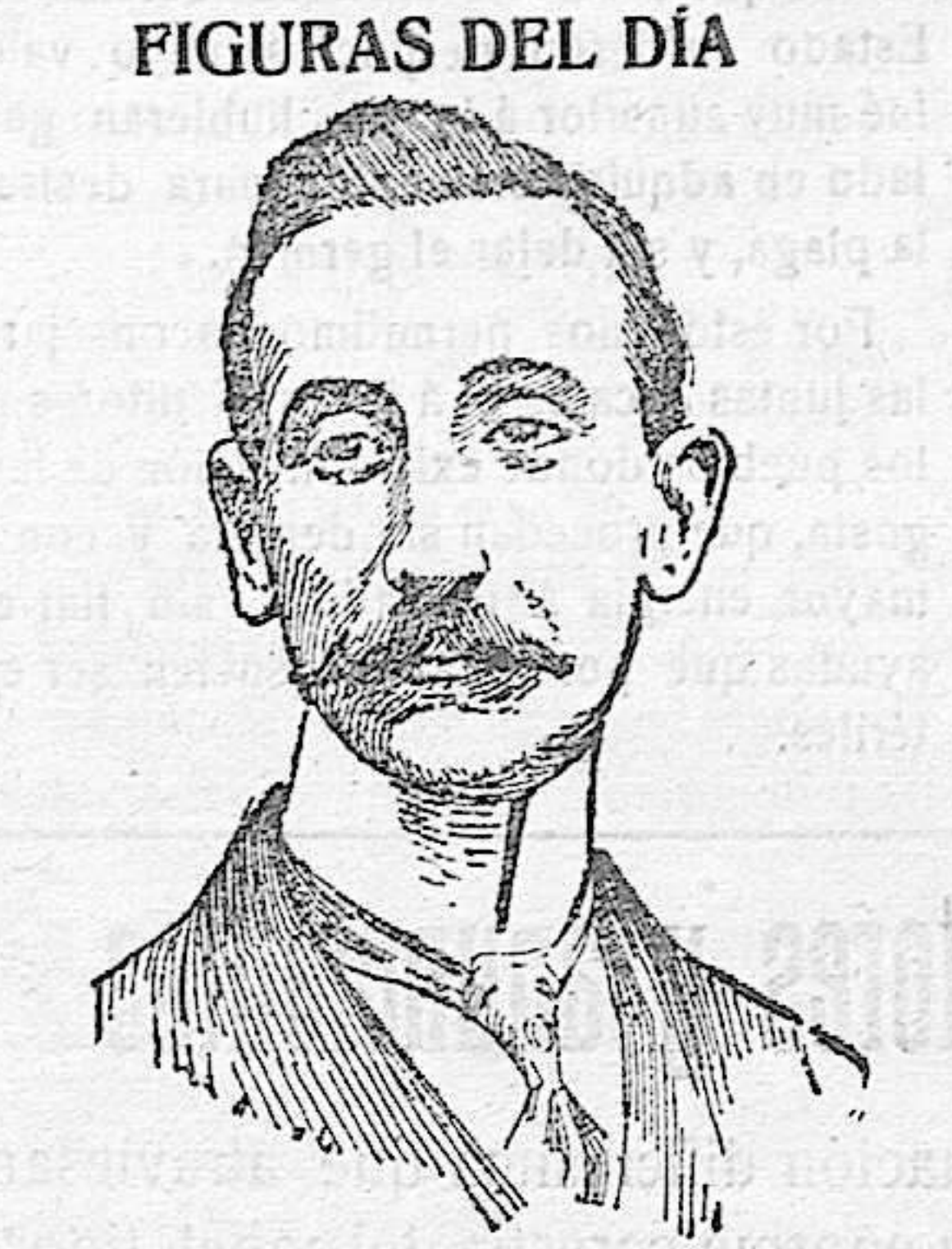
El presidente del Instituto de Reformas sociales Vizconde de Eza, autor de un interesante estudio sobre la Conferencia del Trabajo.